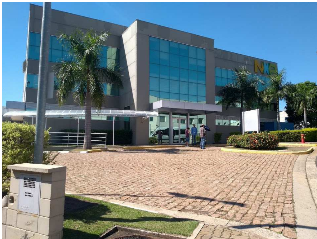
Figura 2 – Brazil Semiconductor Technology Center

trial, de Consumo e de Transações/Acesso seguros. As principais indústrias que desenvolvem e fabricam produtos nestes segmentos no Brasil são clientes da NXP.