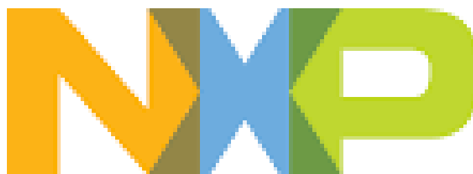
Figura 1 – Logo da NXP

A NXP desenvolve e fabrica dispositivos para os segmentos Automobilístico, Indus-