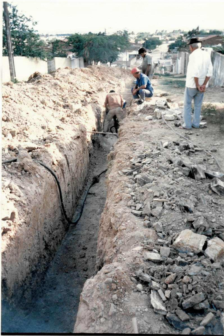
Foto 01 - Escavação da Vala que tem como Materias Predominantes o Piçarro e a Rocha Branda (1,30 x 0,70 m 2 ).