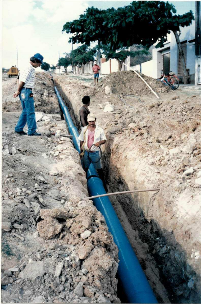
Foto 03 - Colocação da Borracha em um dos Tubos.