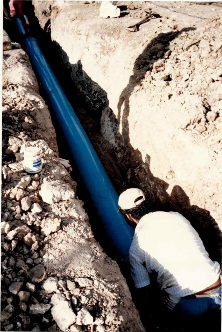
Foto 04 - Encaixe dos Tubos