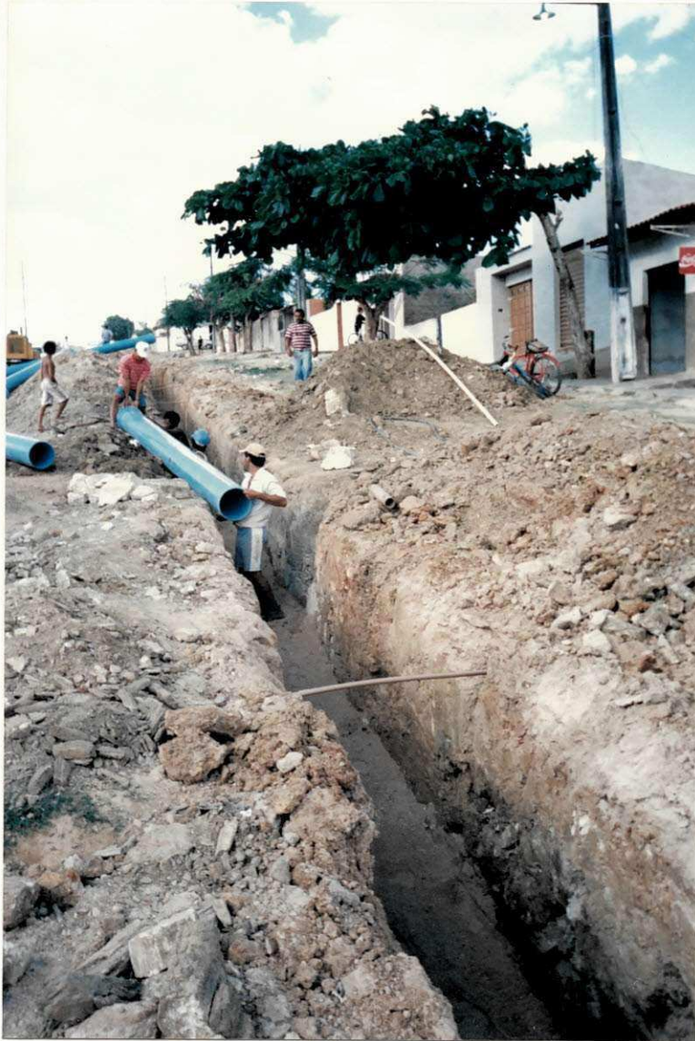
Foto 02 - Colocação dos Tubos.