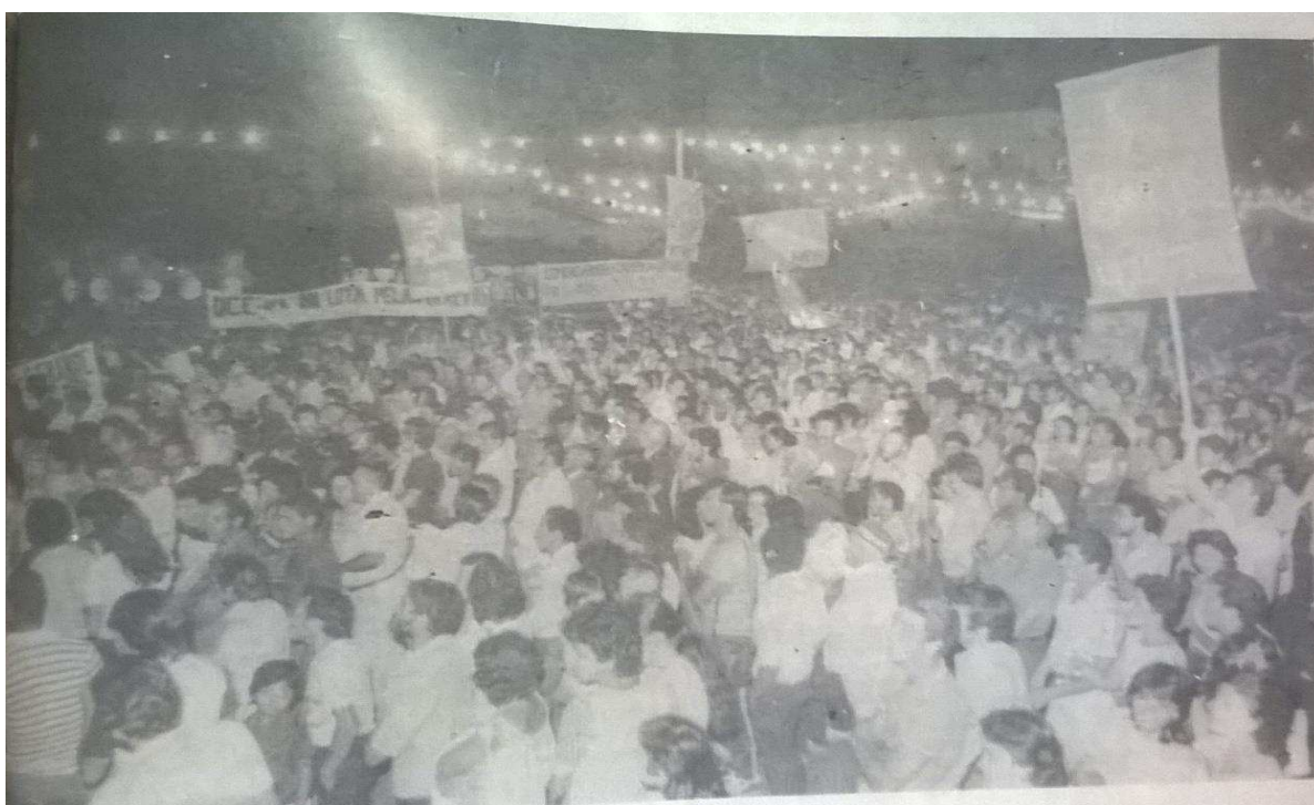
Figura 06. Fotografia do comício da campanha Diretas Já , realizado em Campina Grande – PB, no dia 25 de março de 1984.