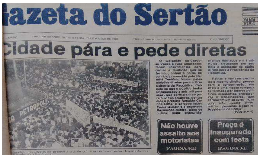
Figura 04. Capa do jornal Gazeta do Sertão destacando o comício do dia 29/02/1984