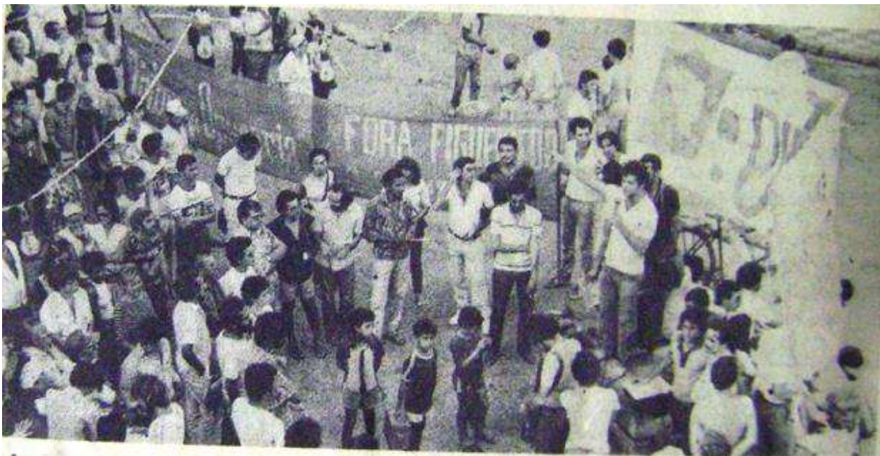
Figura 02. “Comício-relâmpago” realizado em Campina Grande, no dia 03/02/1984.