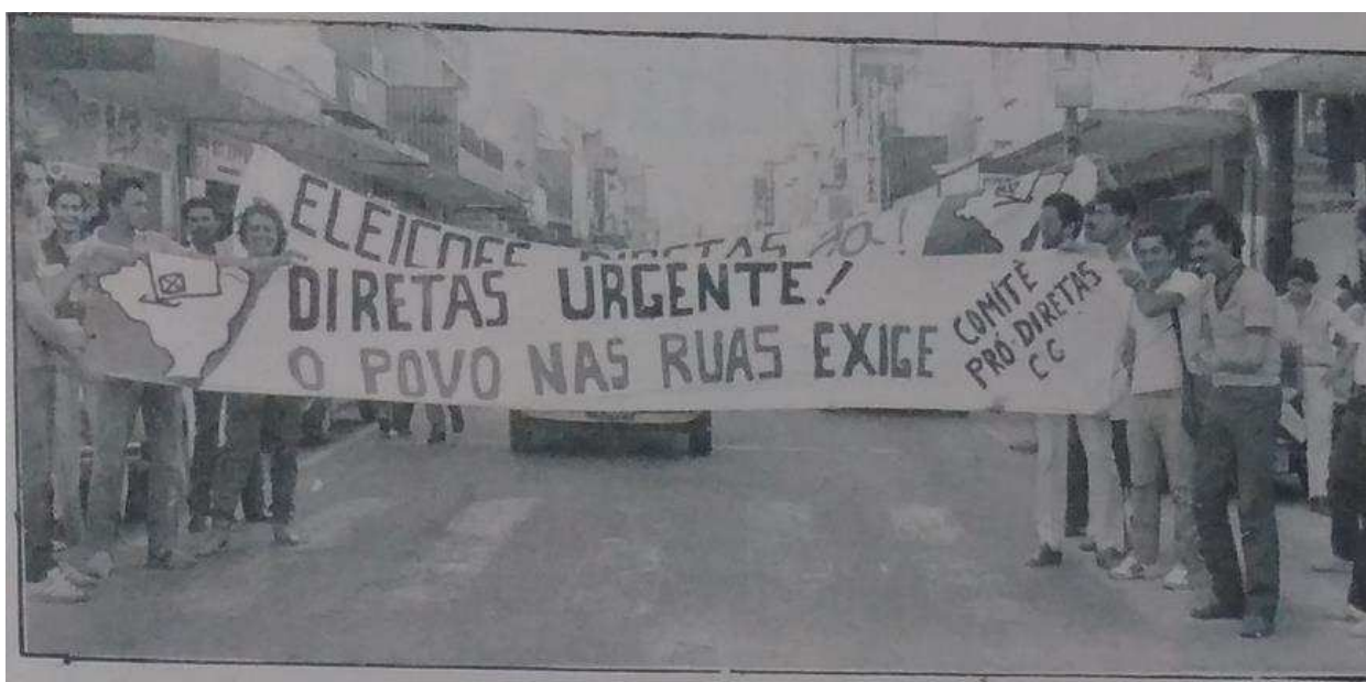
Figura 01. Atividade do Comitê pró-Diretas “Teotônio Vilela”, em Campina Grande-PB.

realizado. Nesse sentido, ao longo da semana seriam realizados esses comícios nos bairros da cidade e na Feira Central. Mais de 50 mil cópias do manifesto elaborado em defesa as eleições diretas seriam distribuídas pela cidade. A Comissão de Finanças, diante dessas tarefas, encontrava-se em plena atividade angariando recursos para o desenvolvimento dos trabalhos. Segundo a reportagem, seriam criados “pedágios” nas ruas da cidade, a fim de conseguir dinheiro necessário ao financiamento de todas as atividades do Comitê 292 .