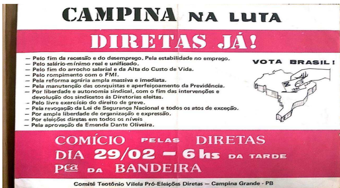
Figura 03. Panfleto do Comitê pró-Diretas de Campina Grande.