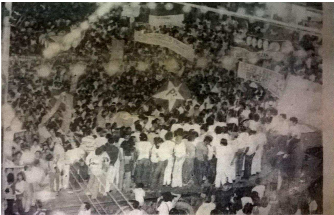
Figura 05. Fotografia do comício da campanha Diretas Já , realizado em Campina Grande – PB, no dia 25 de março de 1984.