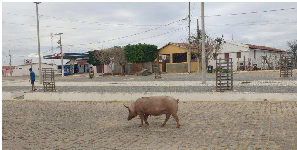
Figura 01: Animal caminhando livremente pelas ruas da cidade de Olivedos-PB.

M.V.S. ao mencionar sobre sua preferência em residir no campo citou a probabilidade de criação de animais, prática esta que é mais comum em sítios e fazendas, porém como citamos anteriormente existe na cidade de Olivedos pontos de criação próxima ao perímetro urbano. Essa proximidade faz com que a circulação de animais e de transportes de tração animal seja comum no dia a dia, costumeiramente se nota a presença deles na paisagem da cidade, como mostra a figura 1, devido à criação localizar-se bem próximo, algumas até dentro da área citadina.