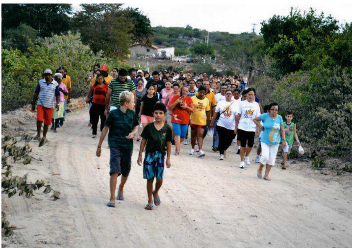
Figura 03: Caminhada penitencial até o sitio aroeiras em Olivedos-PB.

(São Sebastião) que acontece durante todo o mês de janeiro, contando com a peregrinação da imagem do santo nas comunidades rurais, onde se têm a participação, em todos os dias de celebração nos sítios da população citadina, que se deslocam até as casas que recebem a imagem, gerando um momento de interação social entre esses dois lugares. Também pode-se citar o Advento, Natal, Campanha da fraternidade e a Quaresma onde nela se destaca a realização da caminhada penitencial, fazendo o percurso de ida e volta até o sitio Aroeiras (Figura 03).