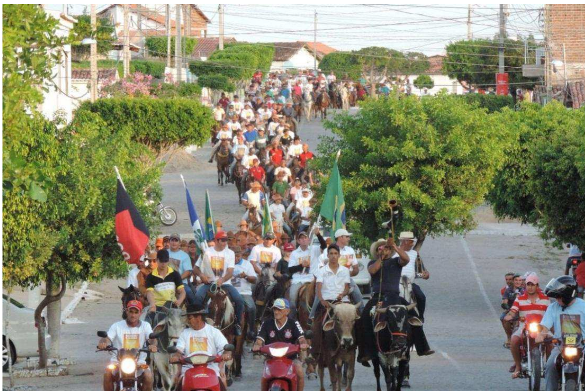
Figura 04: Cavalgada de São Francisco de Assis em Olivedos-PB