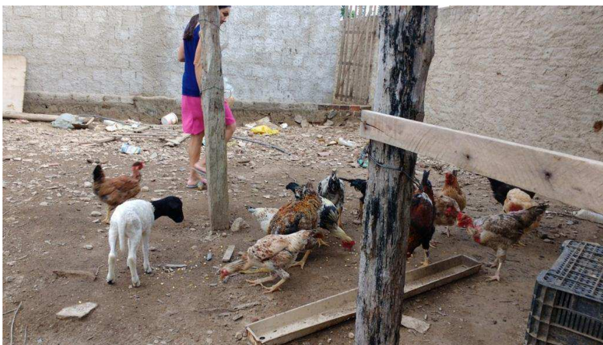
Figura 02: Criação de aves e ovinos no quintal de uma moradora da cidade.

Algumas das habitações da cidade possuem em sua constituição algum tipo de prática relacionada ao campo, a exemplo disto temos que, em períodos favoráveis é bastante comum existir plantações, ainda que em pequenas quantidades, de milho e feijão e pequenas hortas nos quintais dos moradores que auxiliam no dia a dia e comumente encontrada criações de animais como aves e ovinos (Figura 02).