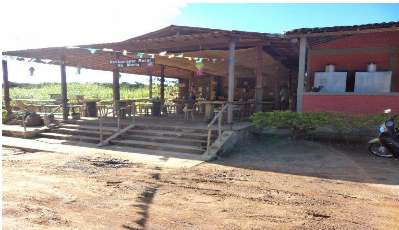
Foto1: Restaurante Rural “Vó Maria”, na Chã do Jardim.

Para uma das coordenadoras da “Associação Para o Desenvolvimento Sustentável da Chã do Jardim 7 ”, existente desde 2006, o grupo tem como principal objetivo promover o desenvolvimento sustentável da comunidade, fazendo com que os jovens permaneçam no local, capacitando-os para o trabalho e incentivando-os a concluírem os estudos.