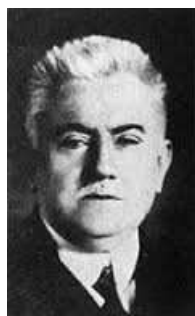
Figura 3.1: József Kurschák

A primeira Olimpíada de Matemática ocorreu no Leste Europeu, mais precisamente na Hungria, em 1894, em homenagem ao Ministro da Educação da Hungria, József Kurschák, professor de Matemática, membro da Academia de Ciências da Hungria e do Instituto Politécnico da Universidade de Budapeste. Essa ideia salutar foi disseminada pelo resto da Europa e para todo o mundo.