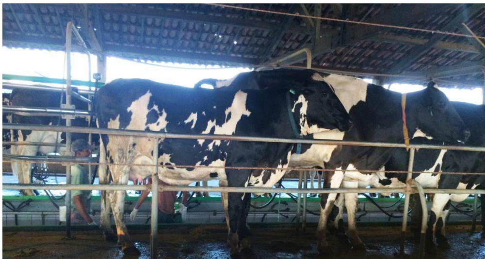
Figura 3: Ordenha das vacas Girolando criadas na Agropecuária Chapada do Moura Ltda. no município de Iguatu, centro sul do Ceará.

A ordenhadeira mecânica tem capacidade para 16 animais, oito em cada corredor. Após o posicionamento destes é feito o teste da caneca do fundo preto e, posteriormente, higienização das tetas que serão encaixadas nas bombas de sucção a vácuo. No intervalo de cada ordenha as vacas são liberadas para os piquetes, permanecendo, assim durante o dia e a noite (Figura 3).