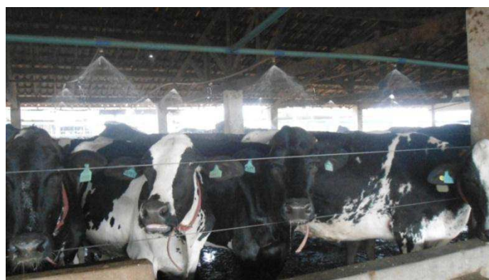
Figura 2: Animais na sala de pré ordenha da Agropecuária Chapada do Moura Ltda. no município de Iguatu, centro sul do Ceará..

O sistema utilizado é o de semiconfinamento e durante o período de produção as vacas são divididas nos seguintes grupos: vacas de alta; média e baixa produção. São realizadas duas ordenhas diárias, sendo a primeira ordenha iniciada às 3:00 horas e a segunda às 15:00 horas. As vacas são conduzidas para o local da ordenha por grupos, de acordo com suas categorias de produção. Cada grupo é levado para a sala de pré ordenha, onde são ligadas as duchas de água por alguns minutos, no intuito de amenizar o estresse térmico (figura 2).