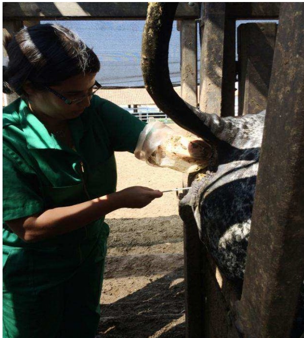
Figura 6: Inseminação artificial nas vacas da raça Girolando criadas na Agropecuária Chapada do Moura Ltda. no município de Iguatu, centro sul do Ceará (Fonte: Arquivo pessoal, 2014).

O protocolo utilizado durante o período do estudo foi o seguinte: D0 (manhã): Aplica 2mL de Benzoato de estradiol + implante. D7: 2mL de prostaglandina ( pgf2\alpha ). D9: 2mL de prostaglandina ( pgf2\alpha ) + 0,5mL de Cipionato de estradiol(ECP) + retirar o implante. D11 (manhã) inseminação artificial (IA) (Figura 6).