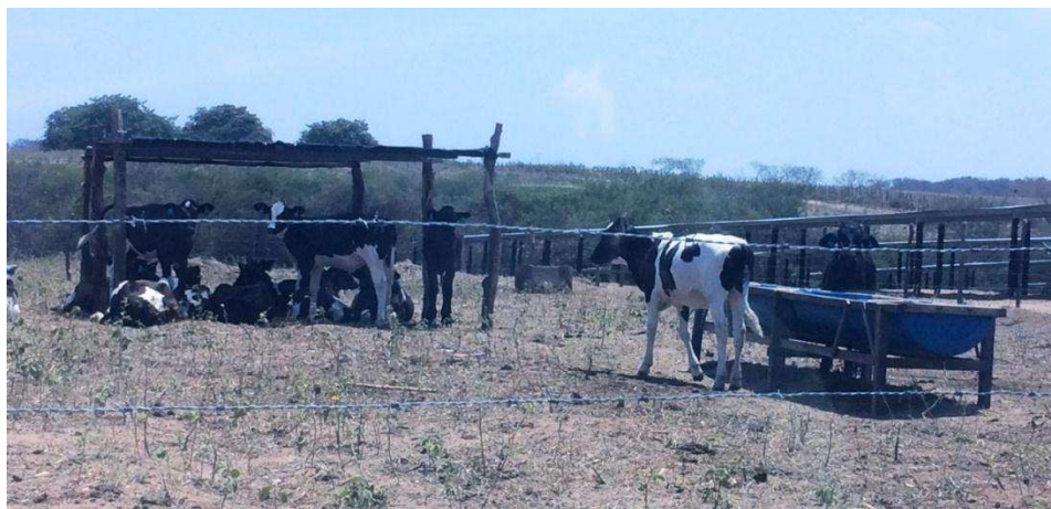
Figura 4: Manejo alimentar das novilhas criadas na Chapada do Moura Ltda. no município de Iguatu, centro sul do Ceará.

*Bezerras e bezerros: ao nascer são separados o mais rápido possível da mãe e levados para um local chamado de “bezerreiro” (figura 5 ). A partir de então, passam a ser assistidos pelo tratador que se responsabilizará pelo fornecimento do colostro (caso não tenha sido ingerido de forma natural) e pelo leite artificial. Os bezerros machos são vendidos de imediato, passando, no máximo, uma semana na propriedade. Já as fêmeas, durante o primeiro mês, recebem apenas o leite artificial, posteriormente, recebem silagem e concentrado.