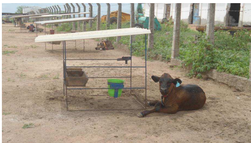
Figura 5: Bezerreiro da Agropecuária Chapada do Moura Ltda. no município de Iguatu, centro sul do Ceará.

*Bezerras e bezerros: ao nascer são separados o mais rápido possível da mãe e levados para um local chamado de “bezerreiro” (figura 5 ). A partir de então, passam a ser assistidos pelo tratador que se responsabilizará pelo fornecimento do colostro (caso não tenha sido ingerido de forma natural) e pelo leite artificial. Os bezerros machos são vendidos de imediato, passando, no máximo, uma semana na propriedade. Já as fêmeas, durante o primeiro mês, recebem apenas o leite artificial, posteriormente, recebem silagem e concentrado.