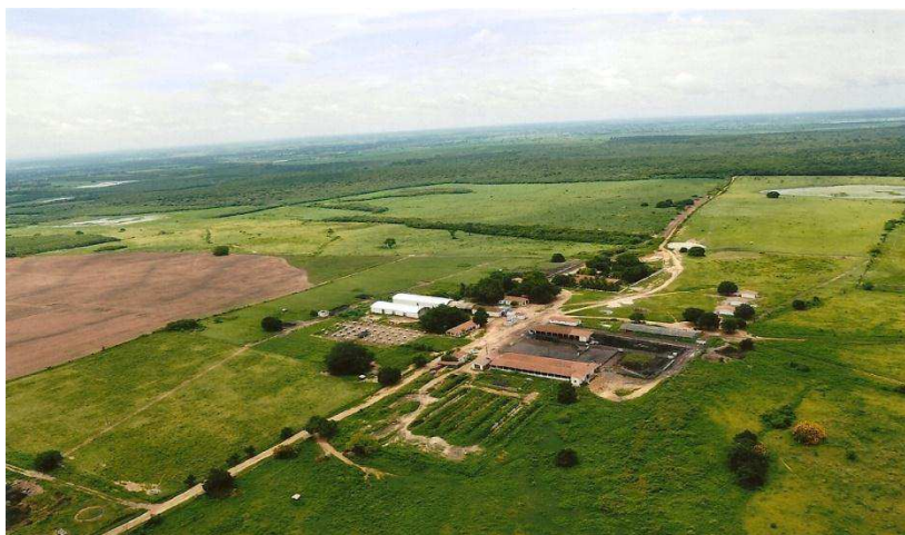
Figura 1: Vista aérea da Agropecuária Chapada do Moura Ltda. no município de Iguatu, centro sul do Ceará. (Fonte: arquivo pessoal, 2014).

A temperatura anual pode variar de 21-37°C, concentrando seus valores máximos nos meses de menos incidência de chuvas e os seus valores mínimos durante a época chuvosa.