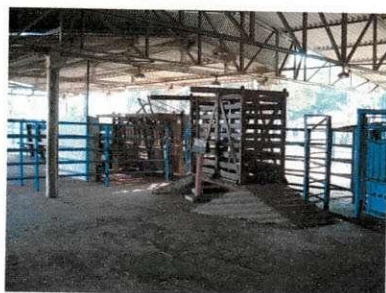
Figura 5 – Balança para bovinos.