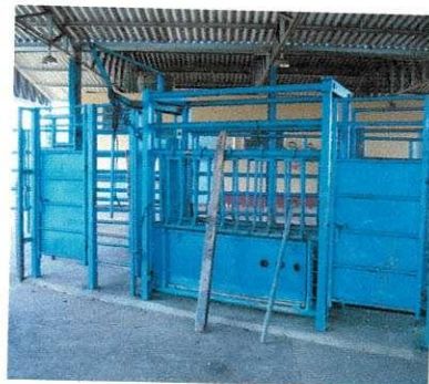
Figura 1 e 2 – Troncos de contenção para bovinos.