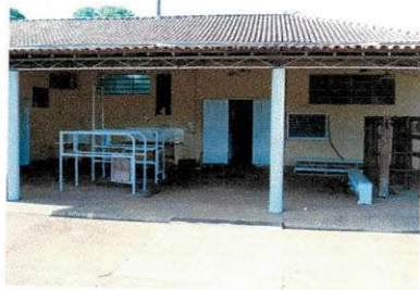
Figura 3 – Vista externa do LBSA.