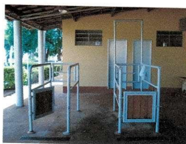
Figura 4 – Troncos de contenção para eqüinos.