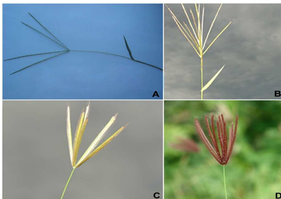
Fig.2. Gramíneas presentes em maior quantidade nas pastagens onde ocorreram surtos de síndrome tremorgênica: A) Digitaria bicornis ; B) Enteropogon mollis ; C) Chloris virgata ; D) Chloris barbata .

Um dos equinos alimentados com gramíneas coletadas na Fazenda 4 apresentou leves tremores nos músculos dos membros anteriores no quinto dia da administração da forragem seca. Esses sinais desapareceram no dia seguinte, apesar de a administração ter continuado ainda por mais dois dias. O outro animal não apresentou sinais após sete dias de consumo.