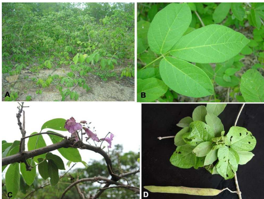
Fig.1. Arrabidaea corallina fotografada no município de Boqueirão, Paraíba. A) Aspecto do hábito em liana de vários espécimes de A.corallina ; B) folhas; C) planta com inflorescências; D) folhas e cápsula.

Ao exame clínico os caprinos apresentavam aumento da motilidade ruminal e intestinal, fezes amolecidas ou diarreicas e depressão, um animal apresentou timpanismo. Seis animais afetados morreram 3-8 dias após o aparecimento dos sinais clínicos. Alguns caprinos apresentavam timpanismo ruminal. Durante a visita foi recomendada a transferência dos caprinos acometidos da pastagem para regime de estabulação. Depois de afetados os caprinos eram separados do rebanho e alimentados com palma forrageira e concentrado (farelo de milho e farelo de trigo). Verificou-se que a diarreia cessava em 1-2 semanas após serem retirados do piquete, porém os caprinos afetados permaneceram magros, sem ganhar peso por um período de algumas semanas ou meses.