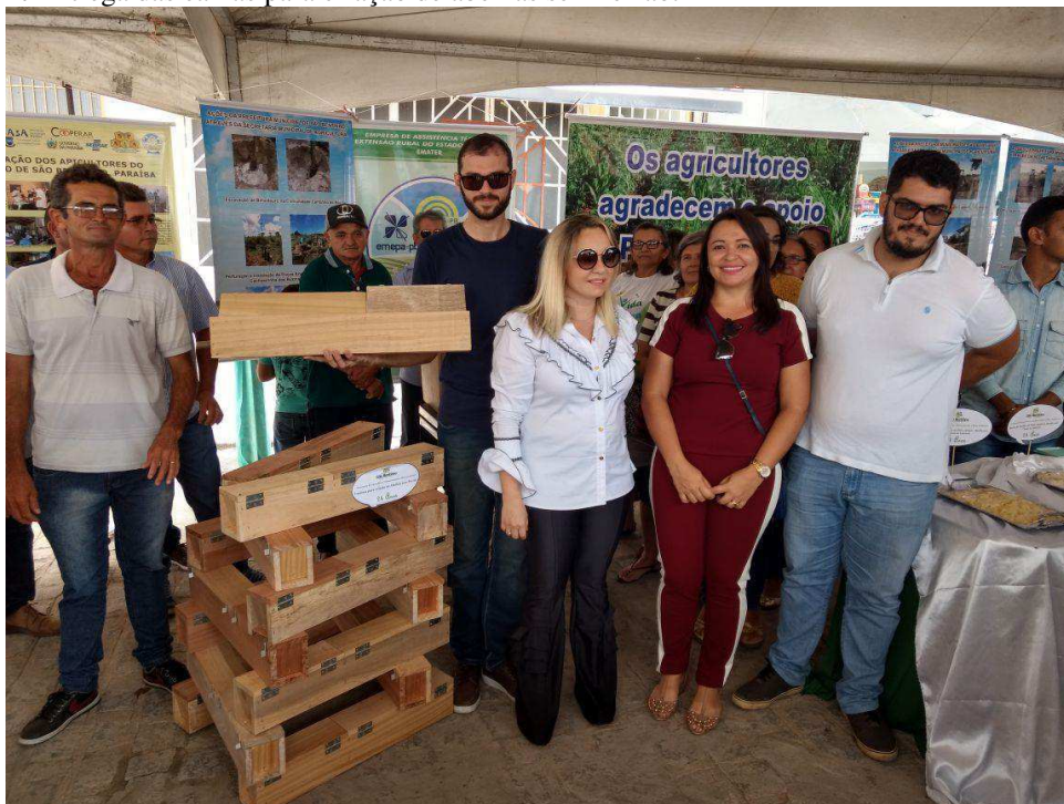
Figura 1: Entrega das caixas para criação de abelhas sem ferrão.

Primeiramente foram ofertadas caixas para os produtores adquiridas em convênio com a Prefeitura Municipal de São Bento do Sul (Figura 1). Após a oferta, foram agendadas capacitações para cursos de boas práticas de meliponicultura em parceria com a Universidade Federal de Campina Grande (UFCG), Campus Pombal (Figura 2).