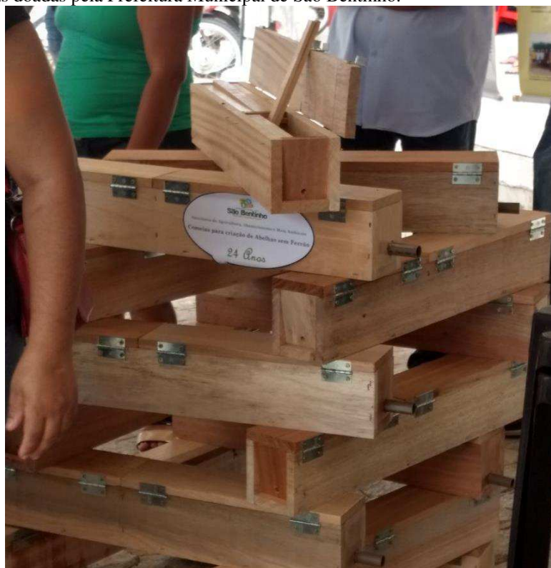
Figura 3: Caixas doadas pela Prefeitura Municipal de São Bentinho.