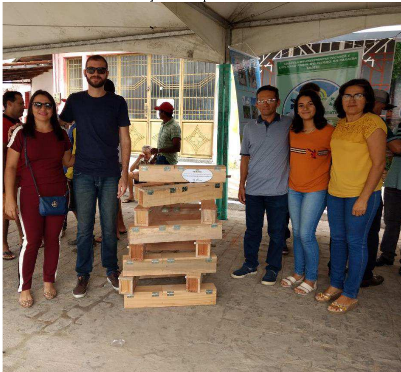
Figura 2: Parceria com a UFCG e Associação dos Apicultores de São Bentinho.