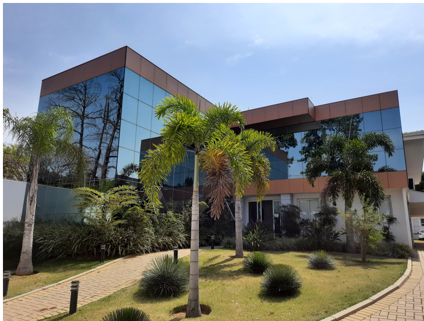
Figura 1 – FiberWork Optical Communications

Fundada em 1998 por Dr. Sérgio Barcellos, a FiberWork desenvolve e fornece soluções de fibra óptica econômicas e tecnologicamente inovadoras para os mercados de telecomunicações e não-telecomunicações. Entre os serviços oferecidos pela empresa, destaca-se: contrato de pesquisa e desenvolvimento; consultoria; treinamentos e cursos técnicos; planejamento, especificação, projeto, instalação, testes e diagnósticos de redes de fibra óptica; além de suporte técnico em suas áreas de atuação. [1]