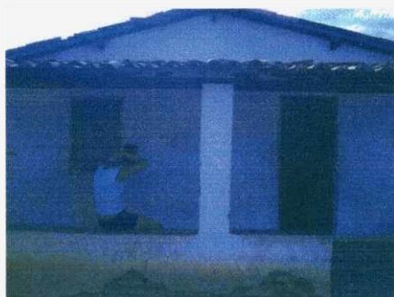
Figura 04: Escola no assentamento do Carneiro.