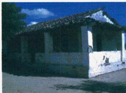
Figura 07: Escola no Assentamento Lages