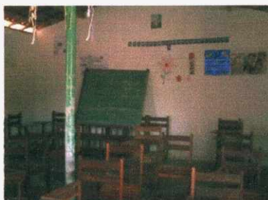
Figura 08: Escola no assentamento Pajeuna