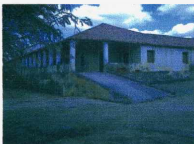
Figura 06: Escola no assentamento do Serrote.