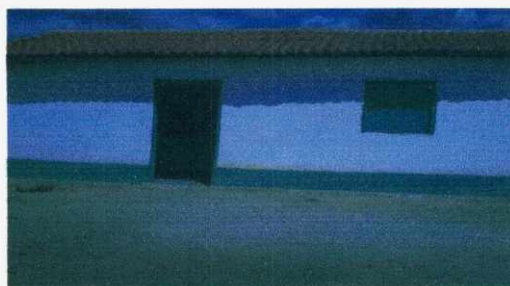
Figura 09: Escola no assentamento 19 de Abril

Como foi citado anteriormente, vê-se o descaso para com a educação do campo, em especial a Educação Especial nos Assentamento de Caridade, onde são atendidas diariamente em regime precário, 444 alunos e apenas 03 (especiais), que foram inseridos no sistema regular de ensino.