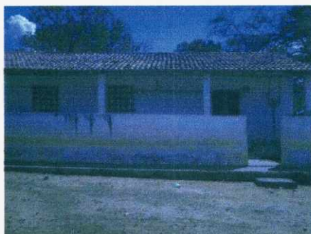
Figura 05: Escola no assentamento do Santo Antonio.