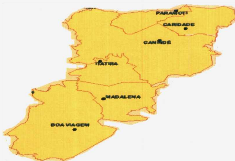
Figura 1: Mapa do território

Congregando 6 (seis) municípios, este território se configura com uma heterogeneidade sócio-cultural, ambiental, guardando algumas características comuns (clima, solos, vegetação, vocações econômicas etc) na região que adentra o semi-árido (onde boa parte desses municípios estão situados), se diferenciando em outros aspectos nas regiões serranas, seja do ponto de vista econômico, cultural, ambiental etc.