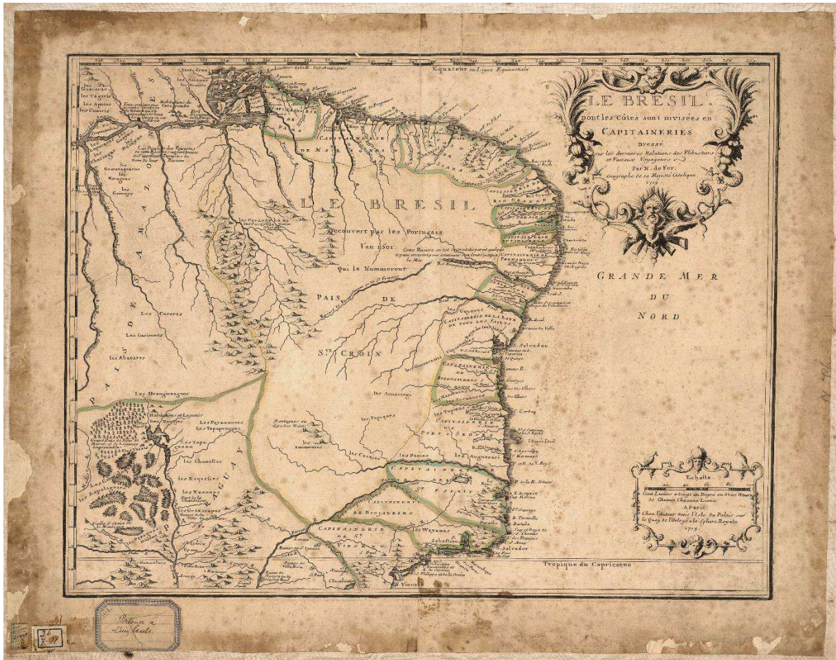
Imagem 1: Cartografia de 1719 sobre a divisão da América Portuguesa em capitanias

Fonte: FER, Nicolas de. Le Brésil dont les côtes sont divisées en capitaineries : dressé sur les dernières relations de flibustiers et fameux voyageurs. Paris, França, 1719. 1 mapa, 42 x 54,5cm em f. 56,5 x 77,5 8 .