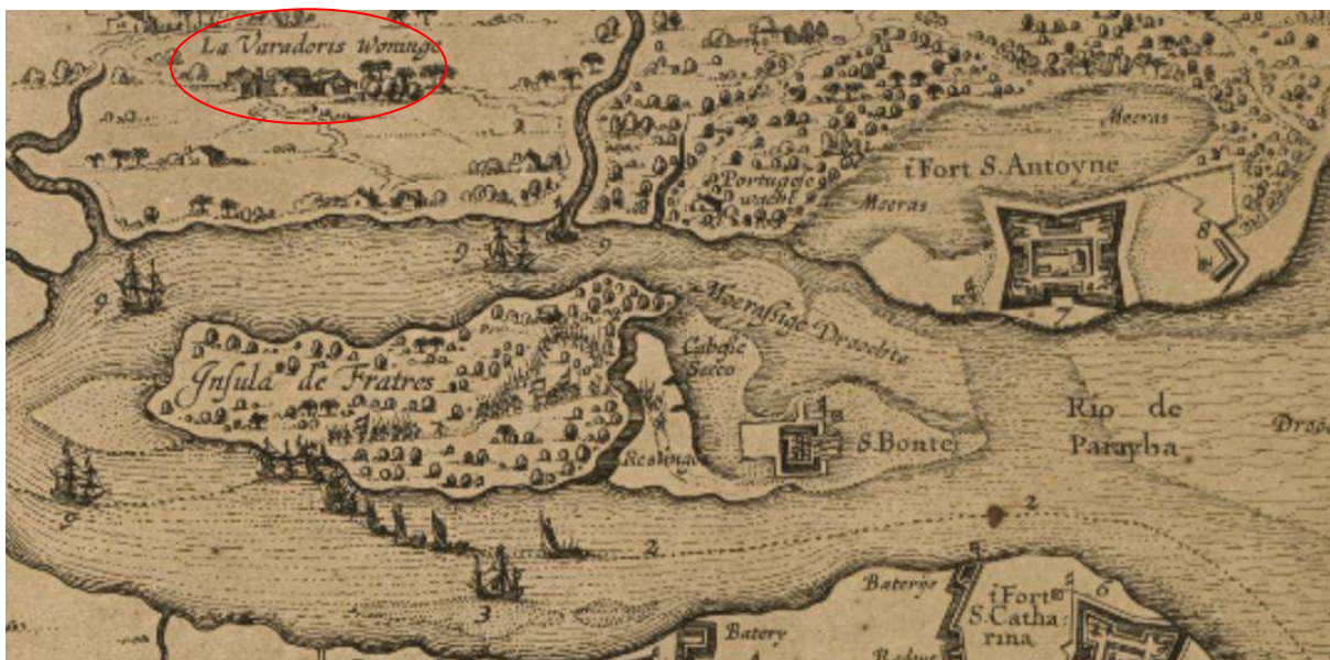
Imagem 4: Recorte ampliado de Cartografia do ano de 1635.