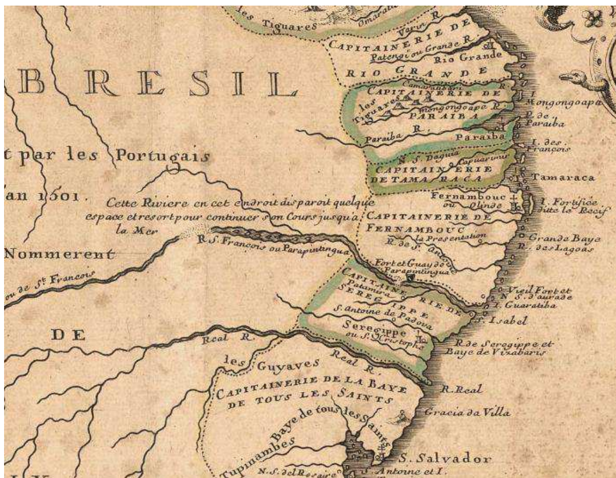
Recorte.

Economicamente falando, a capitania se desenvolvia através dos engenhos de cana de açúcar que estava diretamente associada com a escravidão, tanto indígena quanto africana. Em 1726, o rei D. João V recebeu uma carta 9 contendo uma súplica dos senhores de engenho e lavradores da Capitania da Paraíba sobre a necessidade de se introduzir mil escravos por ano na Paraíba, devido à dificuldade em fazer negócio, pois os compradores queriam ditar o preço da venda dos produtos e o pagamento, era em moedas de ouro, o que também estava em falta na capitania.