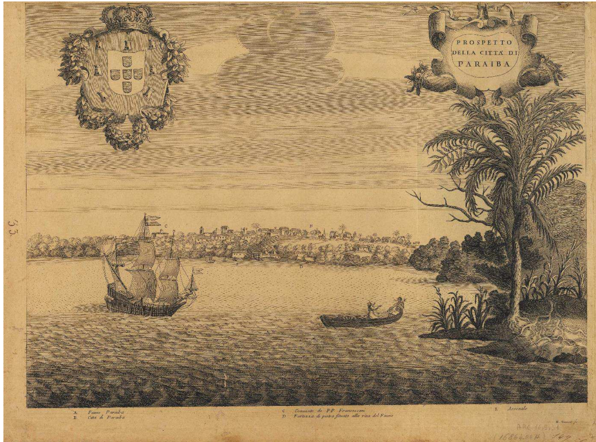
Imagem 3: Cartografia italiana sobre a prosperidade da cidade da Paraíba, de 1698.

Fonte: ORAZI, Andrea Antonio. Prospetto della città di Paraíba . Roma, Itália: Nella Stamperia degl'Eredi del Corbelletti, [1698]. 1 vista panorâmica, gravado em metal, 36,5 x 50,8 cm em f. 40,2 x 54,5 cm. Disponível em: < http://objdigital.bn.br/objdigital2/acervo_digital/div_cartografia/cart1360020/cart1360020.jpg >. Acesso em: 15 mar. 2019.