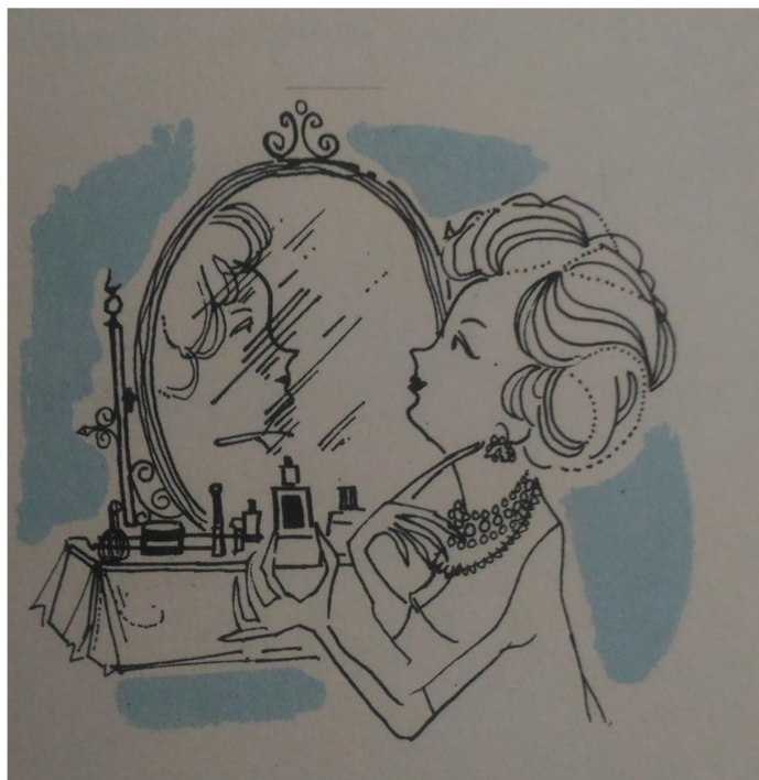
IMAGEM 5: Embelezar-se

seguir as normas. Tendo em vista que, “obedecendo a estas pequenas normas, onde quer que esteja colocada em idade, estado social e financeiro, a mulher contribuirá com sua boa aparência para que se destaque em personalidade, no seu meio. (1961, p. 149)