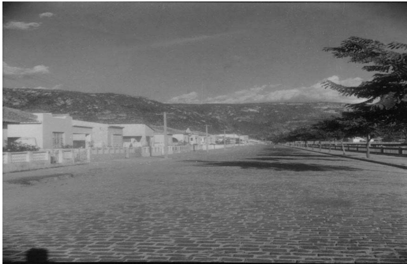
IMAGEM 3 – AVENIDA ORLANDO OLIVEIRA PIRES EM 1962