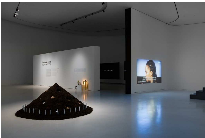
Fig. 3: Exposição Secrets to Tell , MAAT, Lisboa, 2018.

A imagem da escrava Anastácia com uma máscara em sua face circunda o trabalho de Grada Kilomba desde seu texto acadêmico mais conhecido Plantation Memories , não só porque reclama um olhar opositivo interseccional para a arte, mas também porque a artista portuguesa parte de cicatrizes pessoais, memórias familiares e de sua própria subjetividade marcada pelo racismo para construir um percurso autoral e independente através de sua obra. A máscara sempre repõe o interdito, as vozes silenciadas e as histórias não narradas, sacrificadas pelo colonialismo e porque, segundo Grada,