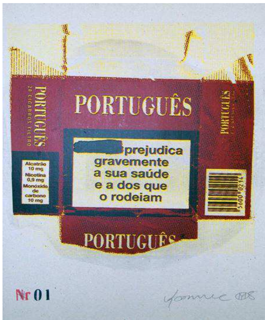
Fig. 1: Português prejudica , serigrafia sobre cartão, Yonamine, Galeria 3+1, Lisboa, 2008.

neste contexto “pós-colonial português” é o angolano Yonamine Miguel cuja instalação Tuga Suave (2008) trago algumas imagens abaixo: