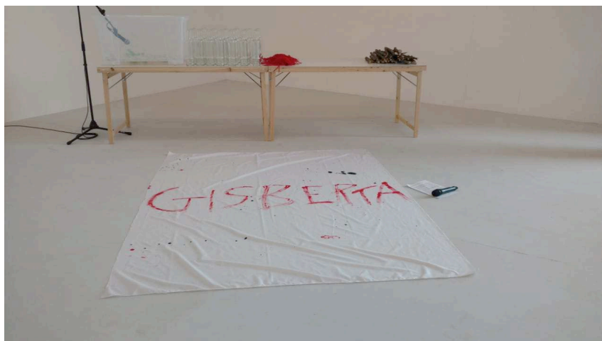
Fig. 4: A gente combinamos de não morrer , Jota Mombaça, EGEAC, Lisboa, 2018.

Também é pela força da palavra que se estrutura o percurso da artista brasileira trans Jota Mombaça. Parto da análise da exposição A gente combinamos de não morrer , realizada em Lisboa em 2018 no EGEAC e inspirada na obra homônima da escritora negra Conceição Evaristo Olhos d'Água . Fazem parte da exposição as obras Mundo=Ferida, A ferida colonial ainda dói, Volume 6, O mundo é meu trauma e Não vão , além da performance em homenagem à travesti brasileira Gisberta, assassinada no Porto em 2006 por um grupo de jovens portugueses.