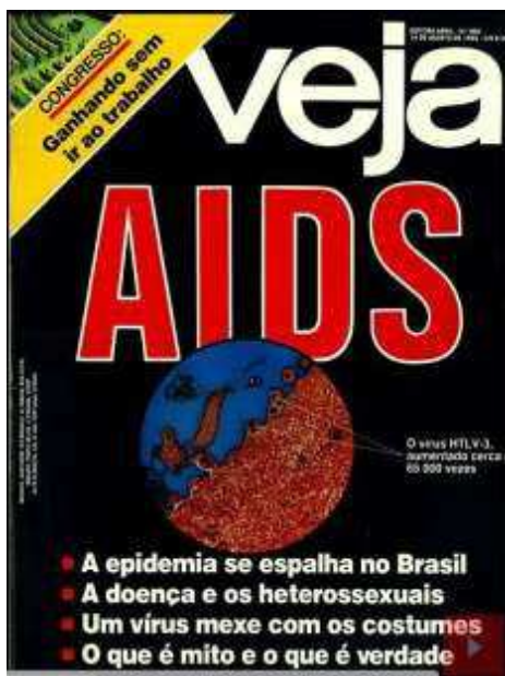
Figura 01 - Veja n. 884, 14/08/1985.

As matérias da edição se valem de um conjunto de características para criar uma ideia de finitude dos homossexuais. Naquele momento, “a doença já provocou 181 mortes no Brasil – 133 delas em São Paulo e o restante no Rio” 5 . A quantidade de mortes tem seu significado como enunciado porque provoca mais impacto. “Com certeza, a atividade homossexual entre homens é o uso por excelência de transmissão do vírus”, destaca a matéria, fazendo uma associação direta da AIDS com a homossexualidade e colaborando no modo como seus leitores passariam a lidar com homossexuais.