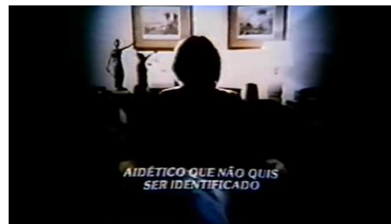
Figura 02 – Estou com AIDS , David Cardoso, 1986.

No filme em questão, detenho-me à leitura da cena que retrata o diálogo entre a psicóloga Ely Gioconda e um paciente que se coloca como homossexual e portador de HIV. A conversa, intermediada por David Cardoso, ocorre em setembro de 1985, um mês após a edição da Veja , cuja capa consta acima e aparece no filme. Observemos a forma como a câmera capta a imagem do depoente: