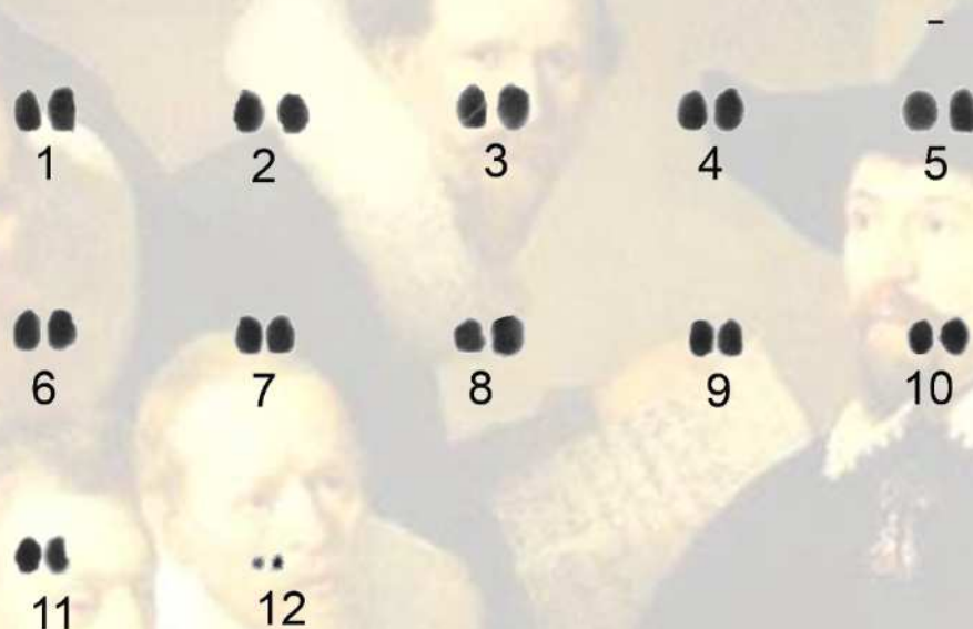
Figura 1. Cariótipo em coloração convencional de Pugilina morio ( 2n=24 , NF=24 ). Barra = 1 \mu m.

A diferença contrastante dos números diploides encontrados para esta espécie pode ocorrer devido à grande distância geográfica entre os dois locais de estudo (15). Contudo, a ausência de cromossomos sexuais em ambos os trabalhos pode indicar a inexistência deste tipo de cromossomo especializado em P. morio .