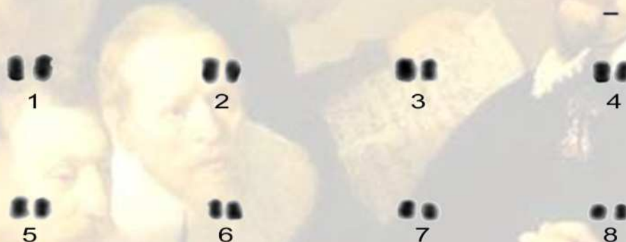
Figura 4. Cariótipo em coloração convencional de Anadara ovalis ( 2n=16 , NF=16 ). Barra= 1\mu\text{m} .

O número cromossômico mais frequente na família Arcidae é 2n=38 e o número fundamental varia entre NF=42 a NF=44 (16). As diferenças no número diploide entre as espécies estudadas e os dados descritos na literatura das espécies até então caracterizadas citogeneticamente, provavelmente ocorre devido à grande distância geográfica entre as populações de bivalves dos continentes analisados e as correntes marinhas (20).