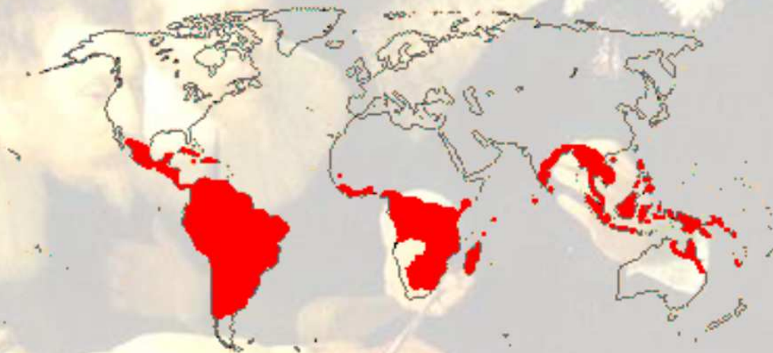
Figura 1: Distribuição do gênero Erythroxylum .

O gênero Erythroxylum é o único gênero representado na região Neotropical, onde aproximadamente 187 espécies são exclusivas (8). Na Colombia foram registradas cerca de 42 espécies, 19 destas presentes na região andina e 7 são endêmicas (9)