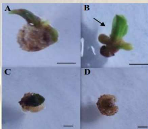
Figura 2 - Aspecto visual de gemas laterais aos 30 dias de cultivo in vitro em meio WPM suplementado com 0,2 \mu M de BAP, após o pré-cultivo na ausência de prolina (A); 0,1 M prolina, evidenciando a parte aérea (seta) (B); 0,2 M prolina (C); e 0,3 M prolina (D). Barra= 0,5 cm.

O meio de pré-cultivo é acrescido de alta concentração de sacarose (0,3 M), o que promove a redução do conteúdo de água dos explantes por desidratação (efeito osmótico). Assim, para obtenção de resultados satisfatórios após o processo de criopreservação, a crioproteção e máxima estabilização das membranas celulares devem ser induzidas através da aplicação de crioprotetores (25). A adição de solutos orgânicos como a prolina ao meio de pré-cultivo pode atuar também desempenhando esse papel, protegendo membranas celulares e enzimas contra danos irreversíveis causados pelo processo de criopreservação (26). Ajudando a manter a estrutura celular intacta, o que lhes permitirá retornar às suas atividades normais após o descongelamento (23, 24, 30).