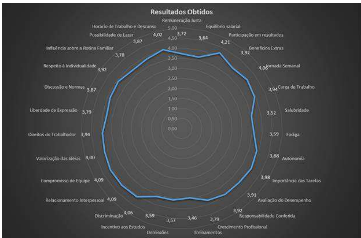
Figura 1 - Radarchart Nível de Satisfação

Destaque positivo para os itens de Participação em resultados, Compromisso de equipe e relacionamento interpessoal, os quais os indicadores obtiveram avaliação com valores acima de 4,0 – Satisfeito e indicando que as ações da empresa relacionadas são bem recepcionadas pelos colaboradores.