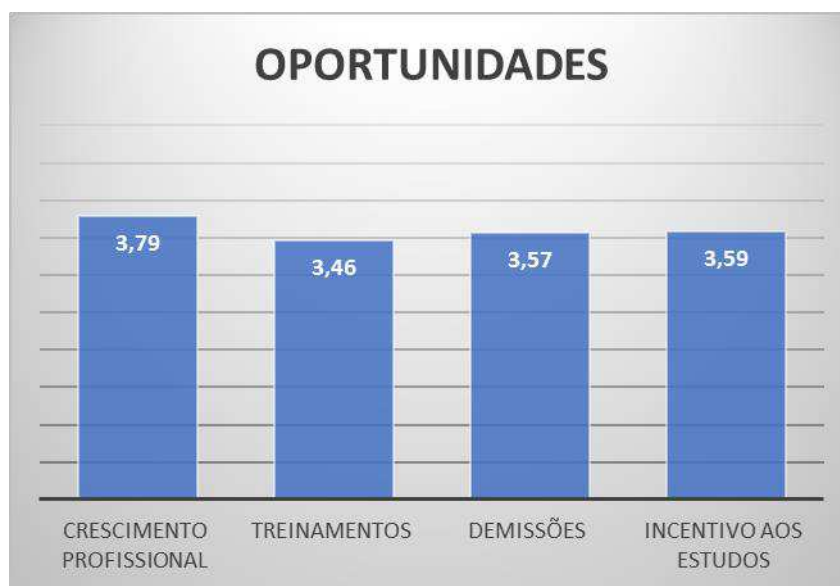
Figura 3 - Nível de Satisfação Oportunidades

Por fim, na categoria oportunidades, avalia-se os indicadores de treinamentos e incentivos aos estudos também como regulares.