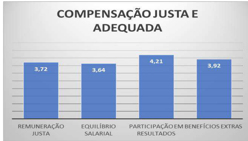
Figura 2 – Nível de Satisfação Compensação Justa e Adequada

Na categoria de compensação justa e adequada, o equilíbrio salarial teve a pior avaliação entre remuneração justa, participação em resultados e benefícios extras.