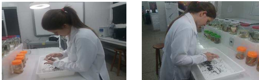
Figura 1. Imagens do beneficiamento das sementes de M. urundeuva no Laboratório de Ecologia e Botânica -LAEB/UFPG/CDSA.

Os frutos coletados foram levados para o Laboratório de Ecologia e Botânica - LAEB/UFPG/CDSA, onde foram beneficiados manualmente.