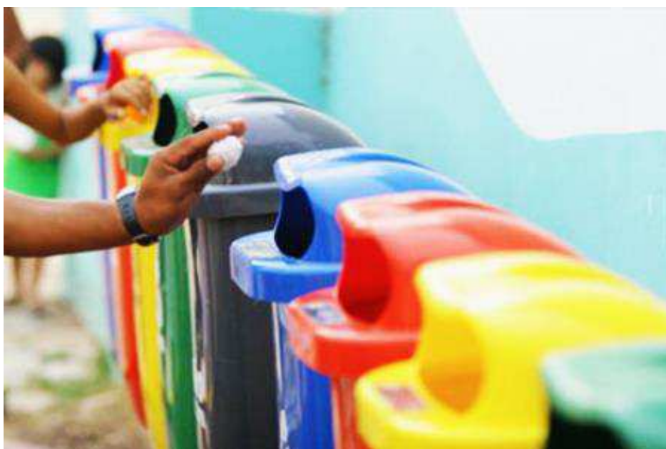
Figura 2. Pontos de Coleta Seletiva.

A universidade, por sua vez, em parceria com a prefeitura municipal de Crato, instalou em diversos lugares dos campi, pontos para coleta de resíduos sólidos, conforme ilustra a imagem acima. Essa iniciativa tem como objetivo a separação dos resíduos a partir dos próprios alunos, como também funcionários e todas as pessoas que por ali passam. Compreende-se que se não houver uma educação ambiental, essa prática pode ser inviabilizada, por esse motivo é que cobram que os professores fortaleçam a ideia de desenvolvimento sustentável, tendo como ponto de partida seus campos de vivência, neste caso, a URCA (Figura 2).