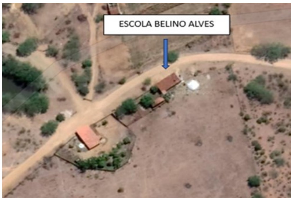
Figura 1 – Escola Belino Alves Feitosa