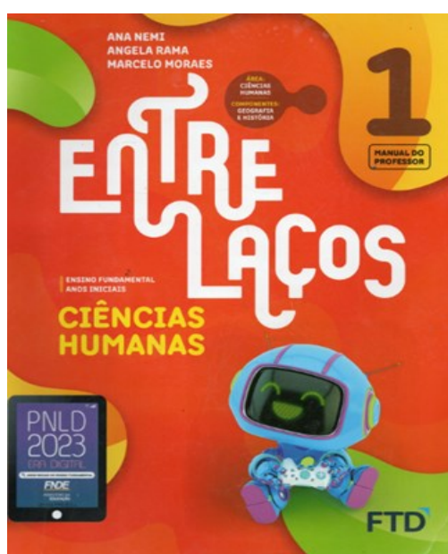
Figura 3 – Livro didático utilizado na escola

A educação geográfica na escola multisseriada do campo EMEF BELINO ALVES FEITOSA, tem como objetivo principal proporcionar aos alunos um aprendizado significativo sobre o espaço em que vivem, a fim de promover sua compreensão e interação com o ambiente. Trabalha-se com o livro didático intitulado “Entre laços: ciências humanas” (Figura 3), que trabalha a conexão entre Geografia e História.