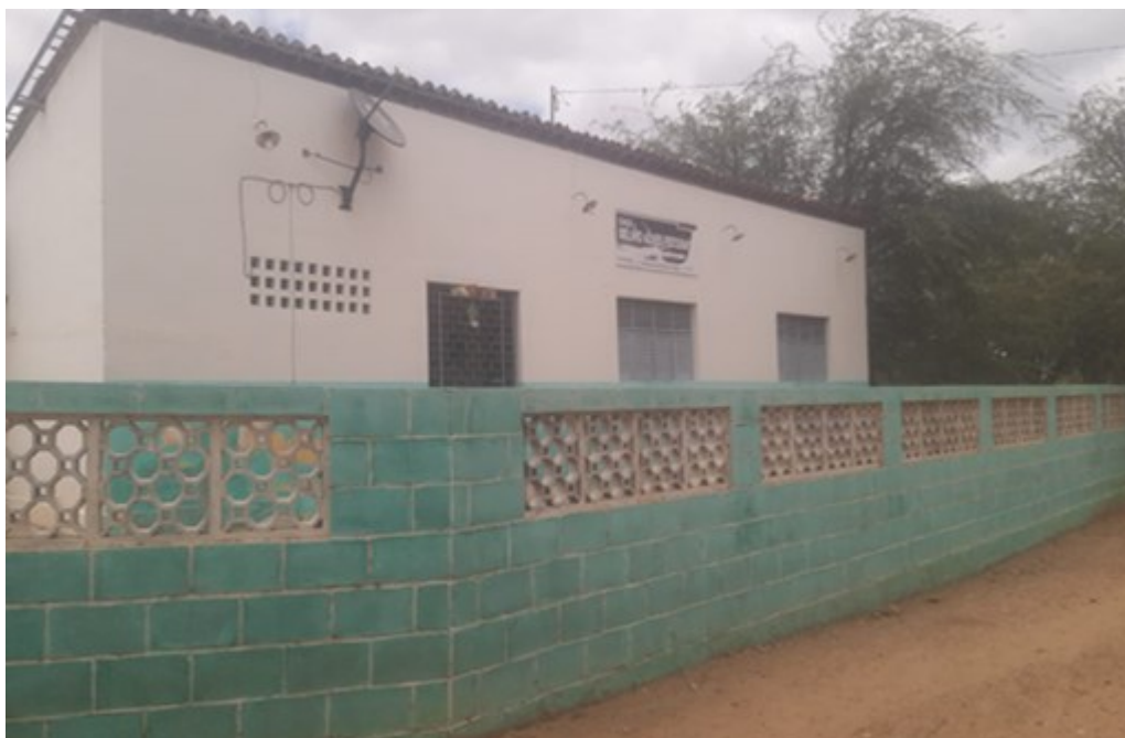
Figura 2 – Escola Belino Alves Feitosa