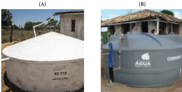
Figura 2 – Cisternas de placas (A) e cisternas de plástico (B)