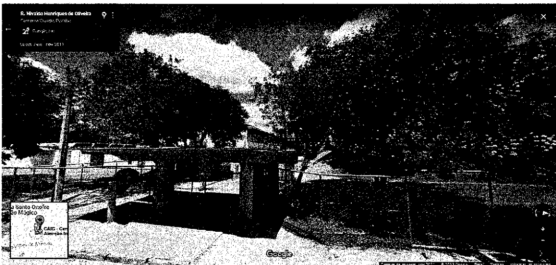
Imagem 2.