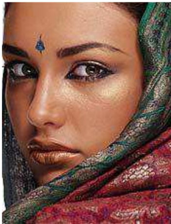
Figura 05. Fotografia de uma modelo islâmica.