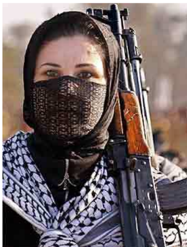
Imagem 06. Fotografia de guerrilheira no Afeganistão.