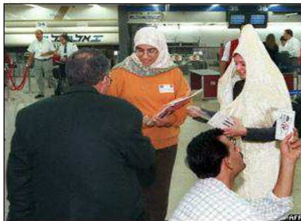
Fotografia 07: mulheres islâmicas.

A Figura 06 retrata a resistência feminina na luta armada no Afeganistão contra a invasão americana; a fotografia tem a intenção de demonstrar a participação de todos na guerra em defesa de seu país, inclusive a participação feminina. A defesa por sua existência, uma característica histórica dos povos que habitaram a região atualmente denominada de Oriente Médio.