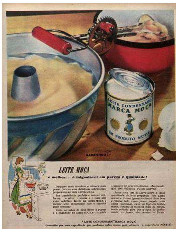
Figura 5. Anúncio do ano de 1954