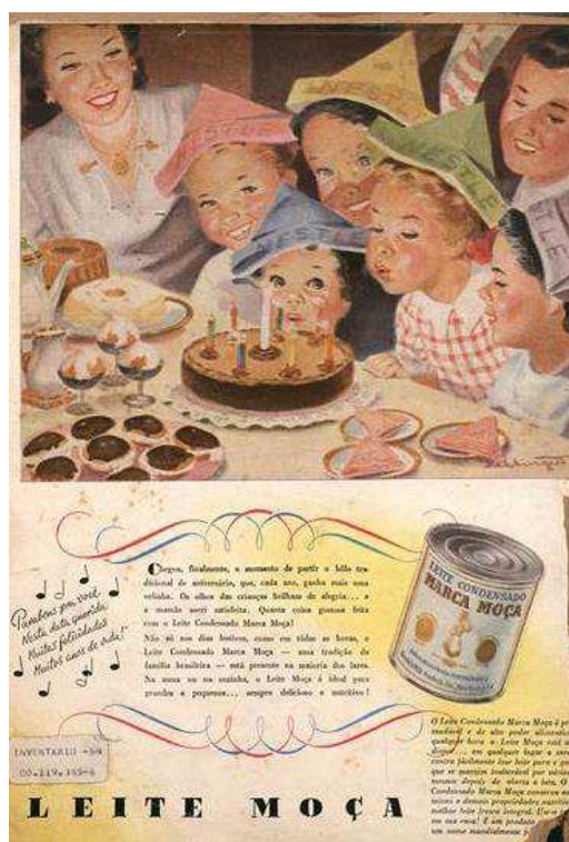
Figura 1. Anúncio do ano de 1950