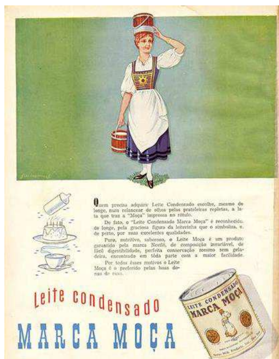
Figura 3. Anúncio do ano de 1950