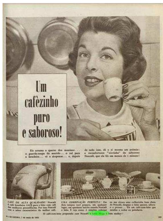
Figura 10. Anúncio do ano de 1955