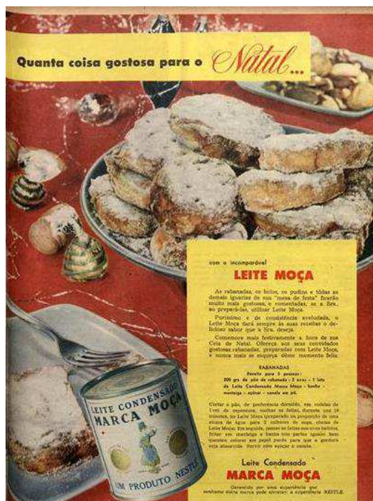
Figura 7. Anúncio do ano de 1954