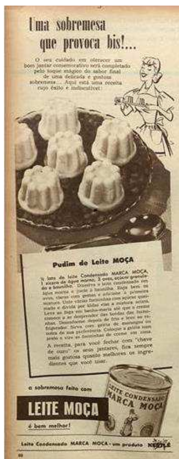
Figura 13. Pudim Nestlé (1954)