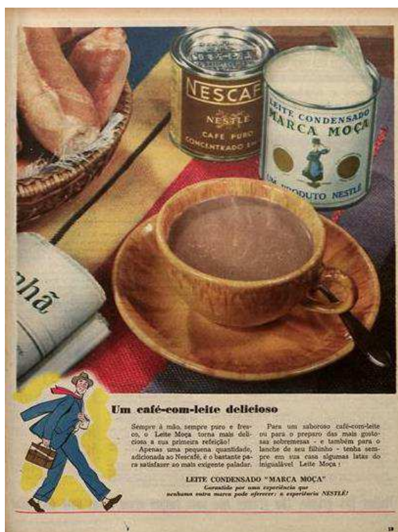
Figura 6. Anúncio do ano de 1954