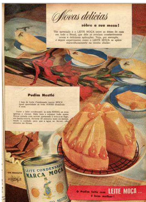
Figura 12. Pudim Nestlé (1953)