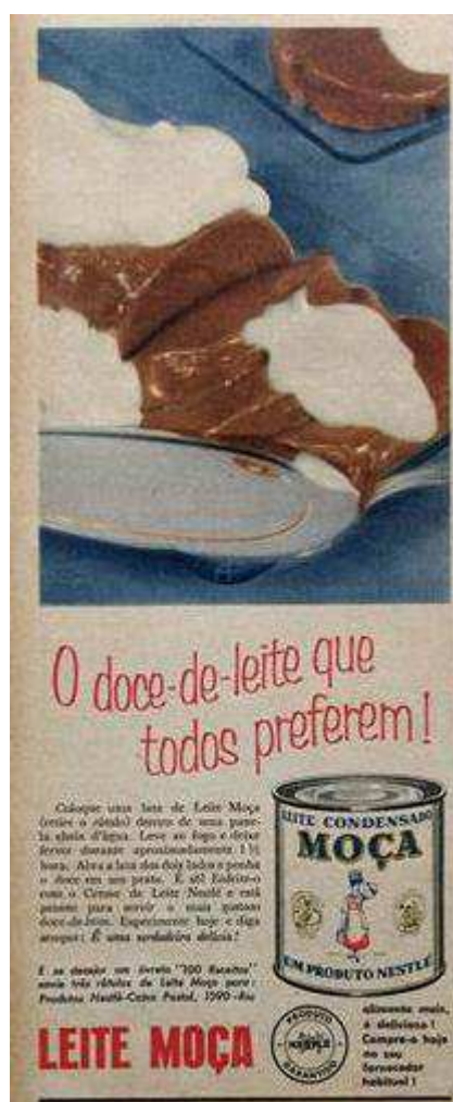
Figura 14. Doce de Leite Nestlé