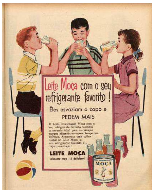
Figura 18. Anúncio do Leite MOÇA do ano de 1957.