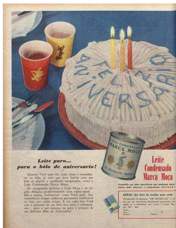
Figura 2. Anúncio do ano de 1955