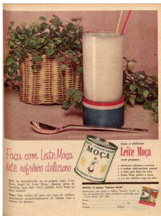
Figura 8. Anúncio do ano de 1956