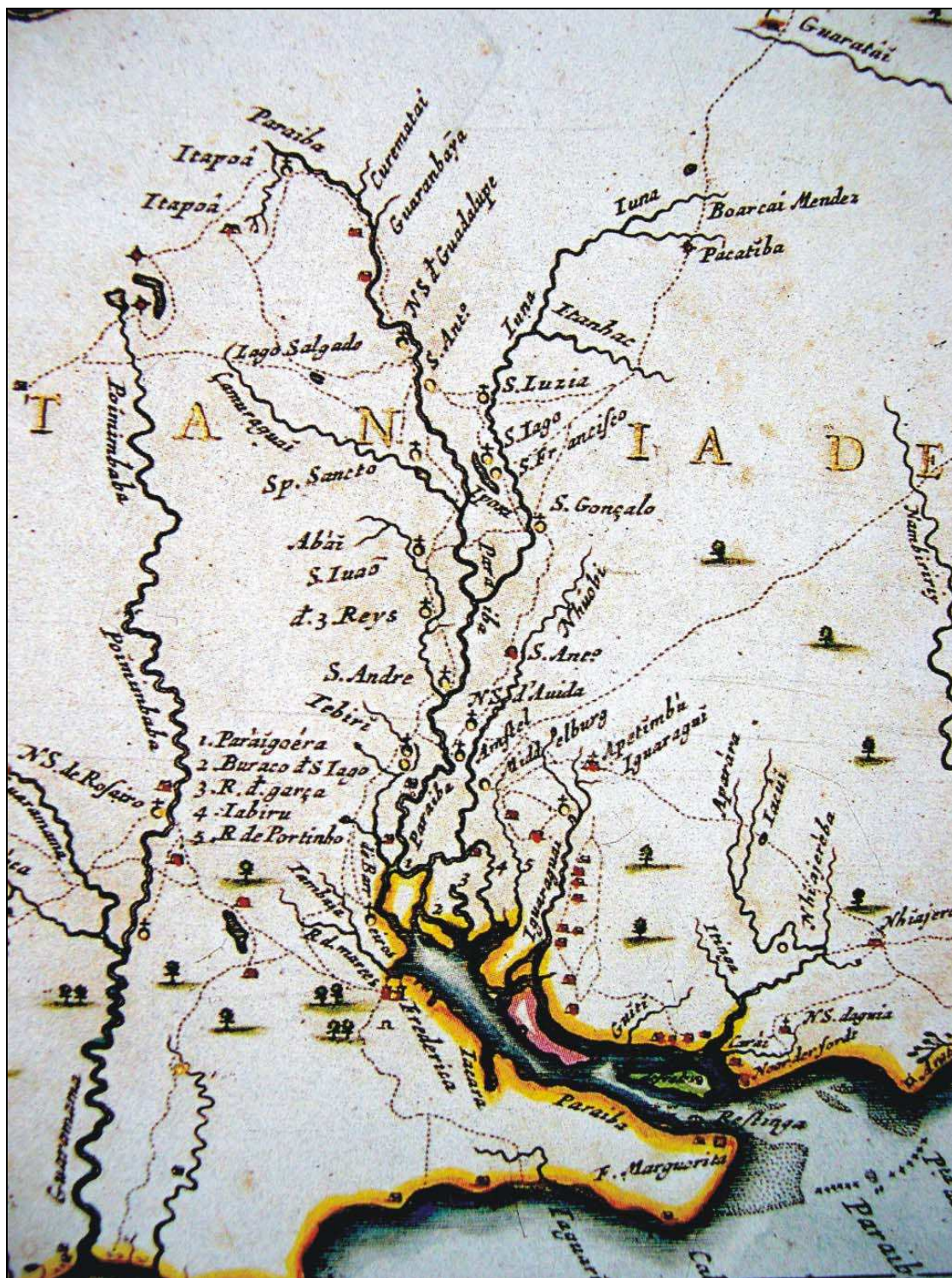
Imagem 3. Baixo curso do rio Paraíba e seus afluentes. Detalhe de: MARCGRAF, Georg. Praefecturae de Paraíba, et rio Grande. 1665. 1 mapa: color.; 41,5cm x 53cm.