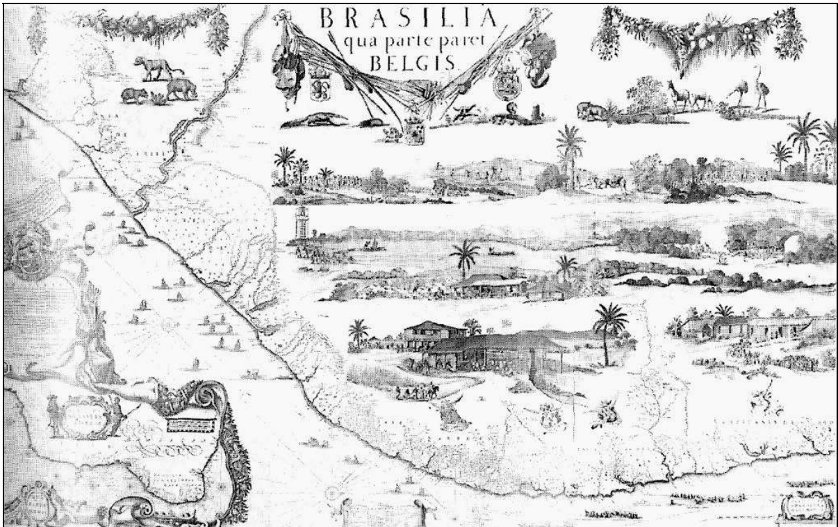
Imagem 1. MARCGRAF, Georg. Brasilia qua parte paret Belgis . 1647. 1 mapa: color.; 121cm x 165,5cm.