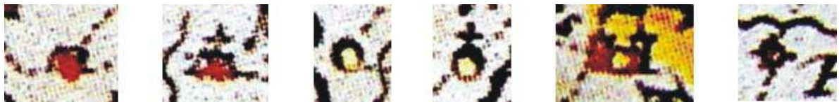
Imagem 5. Da esquerda para a direita: dois símbolos de povoações indígenas, dois símbolos de engenhos, símbolo de cidade e símbolo de curral, retirados. Detalhe de: MARCGRAF, Georg. Praefecturae de Paraiba, et rio Grande . 1665. 1 mapa: color.; 41,5cm x 53cm.