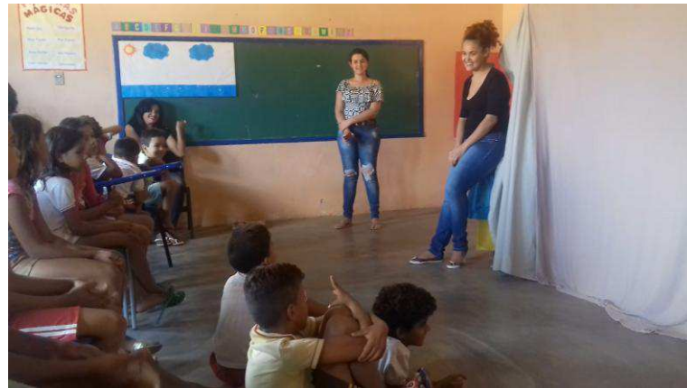
Figura 8 - Roda de Conversa.