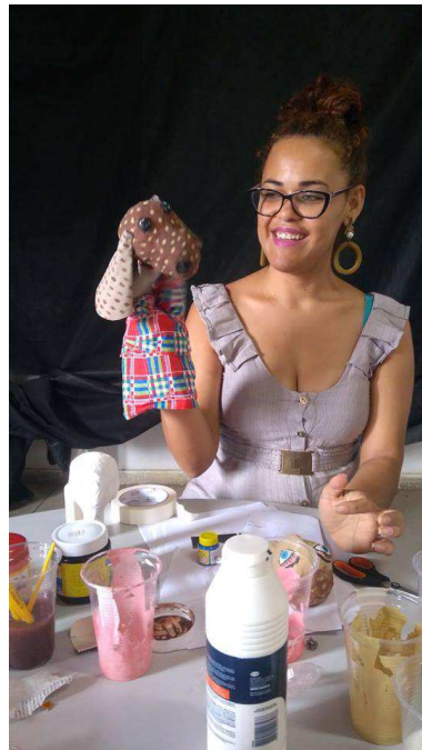
Figura 6 - Oficina de confecção de bonecos

Essa oficina se deu como estratégia de motivação e ponta pé inicial do presente trabalho. Nela pude aprender a fazer bonecos a parti do papel, uma prática de reciclagem, o que dialoga muito bem quando se pensa em fazer um trabalho na área da Agroecologia.