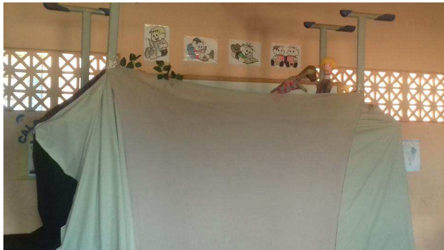
Figura 7 - Apresentação do Espetáculo

A metodologia inovadora do teatro de formas animadas possibilitou uma maior interação com os alunos e professores, não restando dúvida dos resultados obtidos.