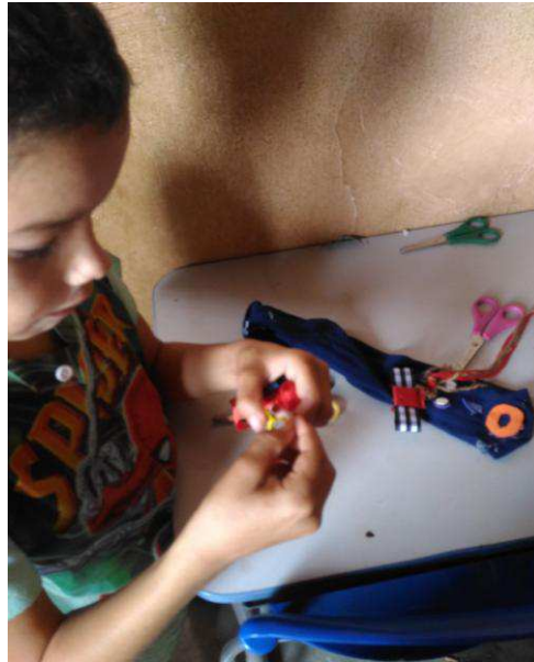
Figura 3 - Confeção de bonecos, aluno da Escola Senador Paulo Guerra