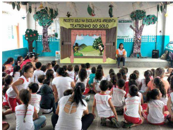
Figura 2 - Teatro de Madeirite