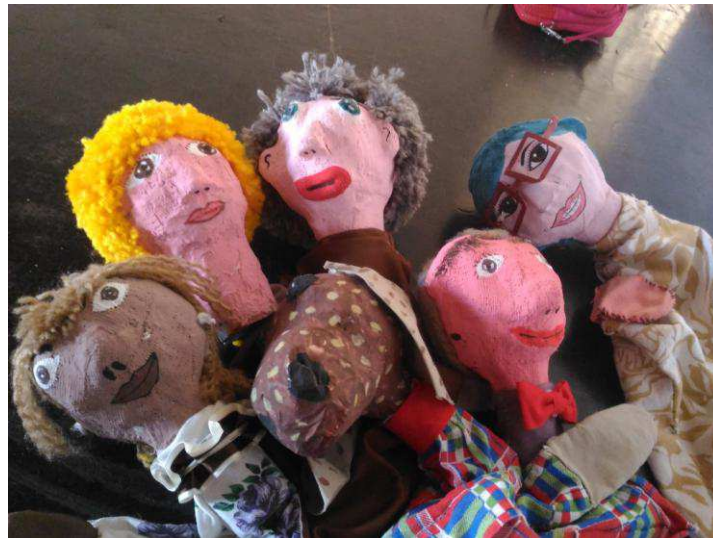
Figura 4 - Visão geral dos Bonecos prontos