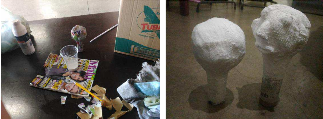
Figura 5: Confeccionando os bonecos