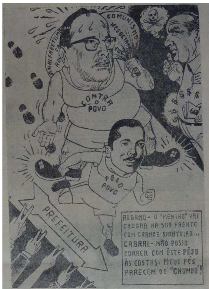
Imagem 3: Charge de cunho político veiculada pelo PTB na caracterização da eleição de 1959.