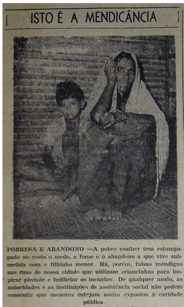
Imagem 2: Fotografia de uma criança de rua e sua possível mãe feita pelos repórteres do Diário da Borborema em mais uma de suas “caminhadas pela cidade em busca da verdade”.