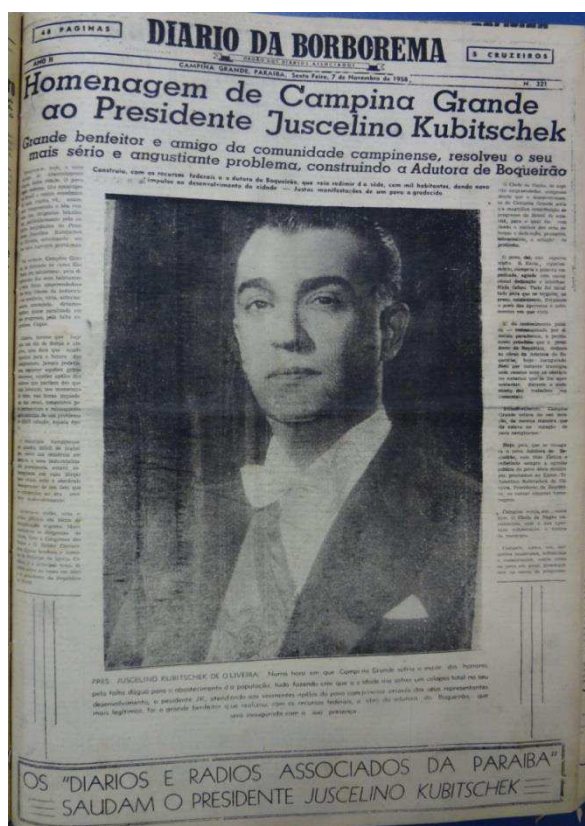
Imagem 1: Reportagem de capa acerca da visita de Juscelino Kubitschek à Campina Grande para inauguração da Adutora de Boqueirão.

Sobre esta imagem construída sobre o presidente, encontramos durante o desenvolvimento de nossa pesquisa, nas páginas do Diário da Borborema, fotorreportagens icônicas para o entendimento do momento que analisamos exibindo em seus traços os sentimentos e discursos que se pretendem ali perpassar e transmitir. Discursos estes que, como já exposto, trazem consigo o despontar da cidade como importante espaço no contexto regional no qual está inserida, que jogam luzes às benesses que a cidade de Campina Grande já possuía e de Juscelino Kubitschek como seu maior interventor, sinalizando decerto para os responsáveis e os intuitos da construção destes enunciados. O anseio social do qual falamos, do desejo de viver tempos prósperos também se fez presente entre os campinenses, de acordo com as crônicas que se destacaram durante a pesquisa.