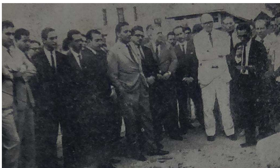
Imagem 5: Foto da solenidade do lançamento da pedra fundamental da futura sede da “Telecomunicações de Campina Grande S. A.” (TELINGRA), de iniciativa municipal.