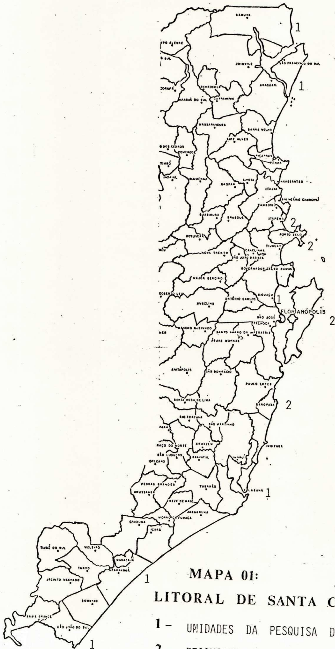
MAPA 01: LITORAL DE SANTA CATARINA