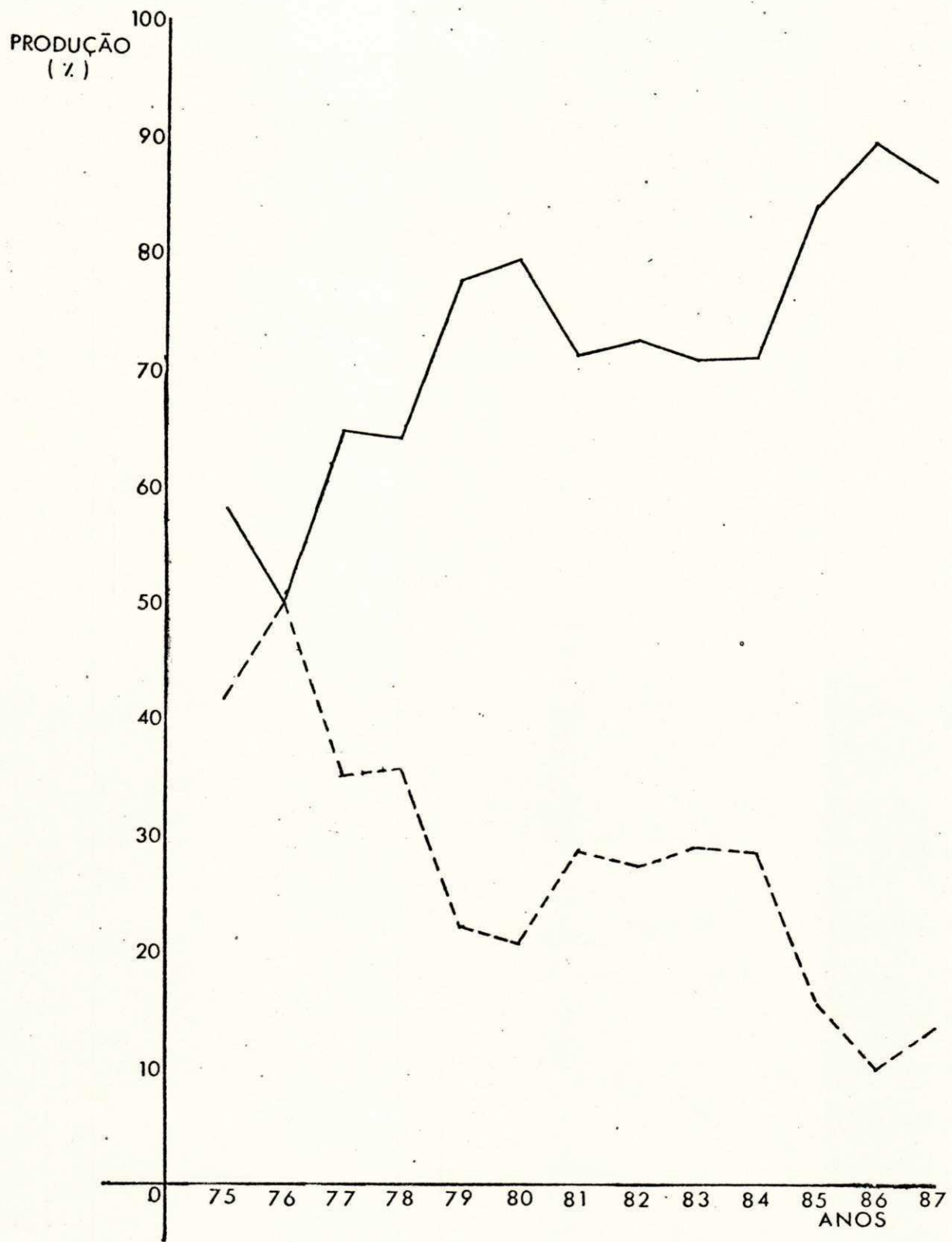
GRÁFICO 01: PRODUÇÃO DE PESCADO DE SANTA CATARINA, SEGUNDO O TIPO DE PESCA (1975/87)