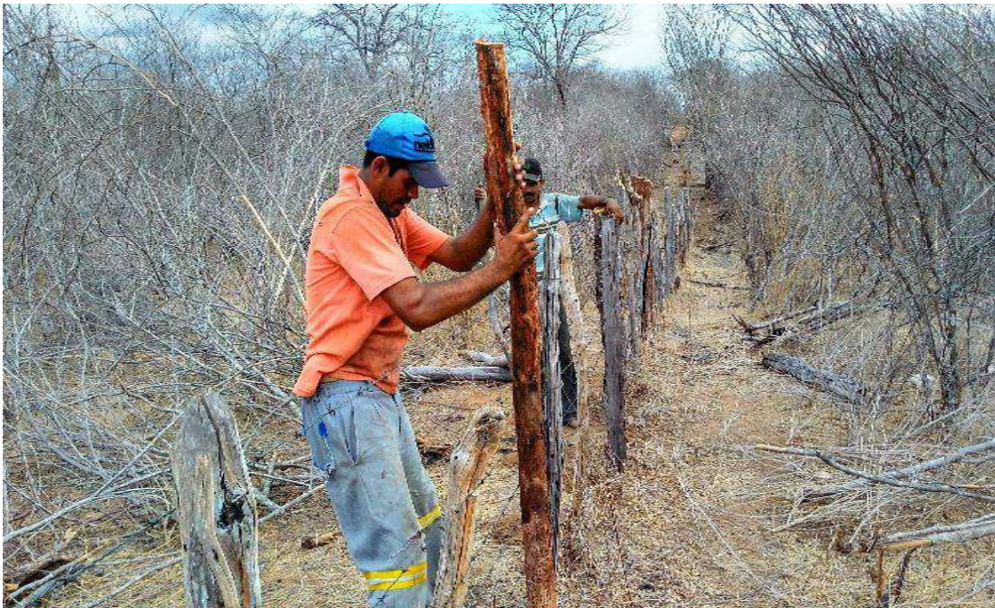
Foto 03 - Camponês construindo cercas de arame farpado (unidade de medida).