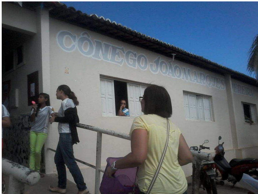
Foto 1 - Escola