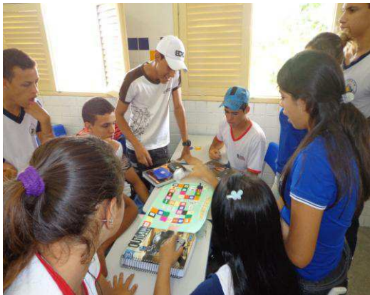
Figura 4- Desenvolvimento do jogo