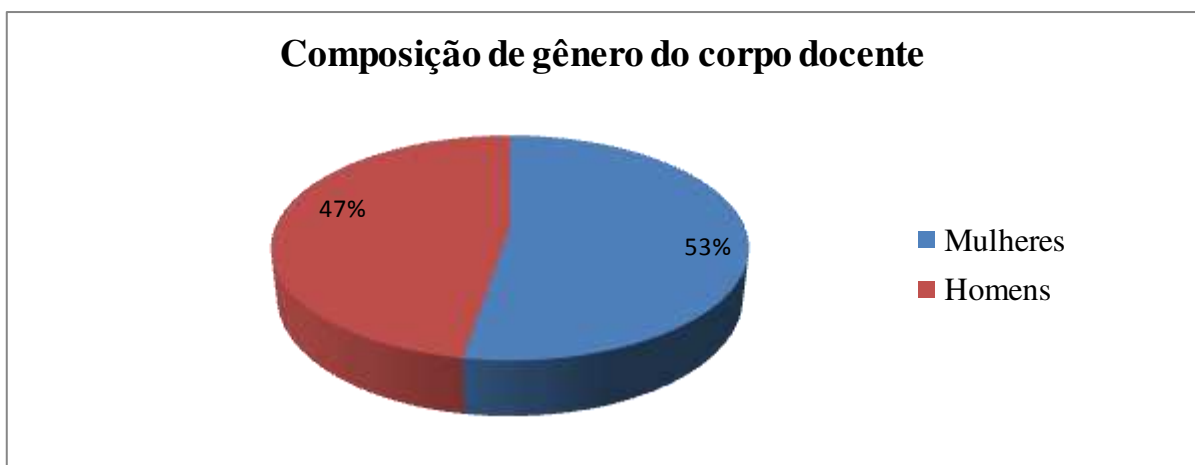
Gráfico 2 – Composição de gênero do quadro docente da escola Maria Emilia, no ano letivo de 2013