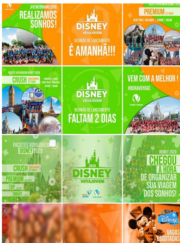
Figura 2. Contagem regressiva do Instagram @voyatour.

Já as Figuras 2 e 3 foram extraídas do segundo Instagram, o @voyajovem, no qual as publicações concernem mais a divulgação dos pacotes, com roteiros e períodos, por exemplo, mas não foi observada a divulgação dos preços nesse perfil, de modo que o foco se estende para mostrar a esse público as opções ofertadas pela agência; são feitas postagens com contagem regressiva para as viagens; promover encontros dos que viajaram; e, principalmente, publicar fotos dos clientes.