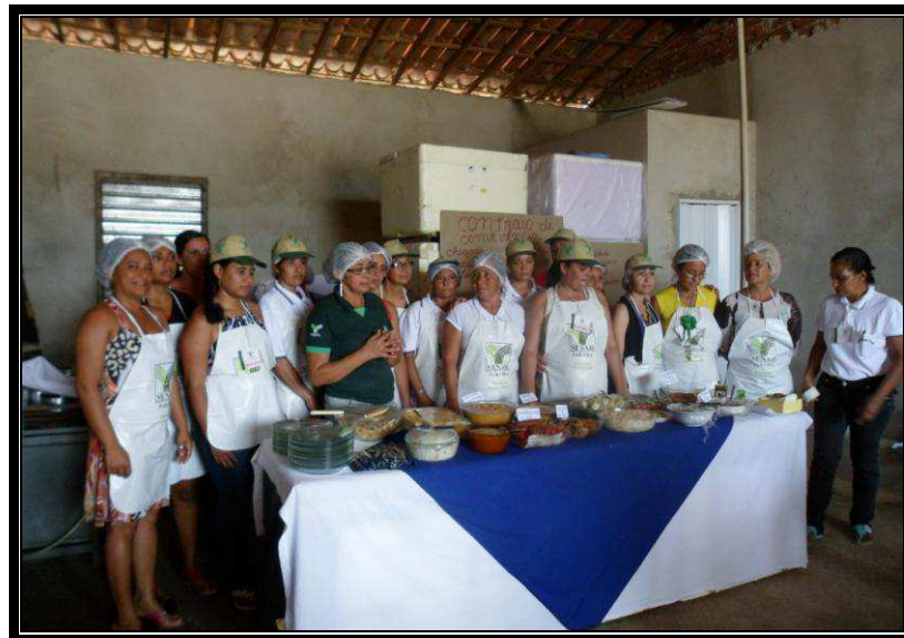
Foto 3 - Oficina de produção de alimentos 08/2012.

O SENAR desenvolve atividade formadora com as mulheres pescadoras da associação em Sumé, e vem a atender o desenvolvimento técnico profissional, capacitando e aprimorando as atividades produtivas com as mulheres pescadoras.