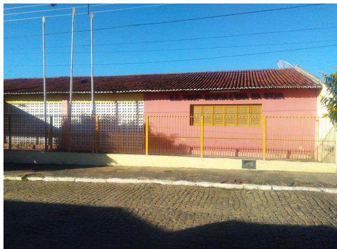
Figura 1: Frente da Escola Estadual Professora Maria Lídia da Silva

O trabalho foi realizado no município de São Bento do Trairi, município localizado no interior do estado do Rio Grande do Norte, divisa com o estado da Paraíba, na Escola Estadual de Ensino Fundamental e Médio Professora Maria Lídia da Silva, em uma turma de 8º ano do ensino fundamental regular.