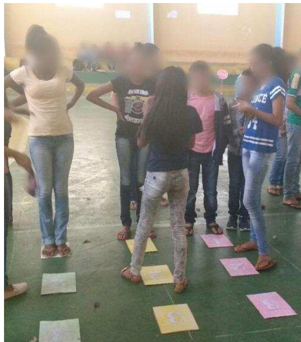
Figura 13: Jogo da corrida/etapa da transformação de atitudes

Este jogo foi confeccionado com caixa de papelão, de modo que nos pedaços da caixa tinham os números 1, 2, e 3 em três colunas, cada coluna tinha uma cor: vermelho, amarelo e verde representando as cores do semáforo. Três alunos se posicionavam para começar a brincadeira, cada cor tinha um envelope com perguntas relacionadas ao trânsito, quem acertasse ia passando de fase, pulando de um número para o outro; quem acertasse todos os questionamentos ganhava um prêmio.