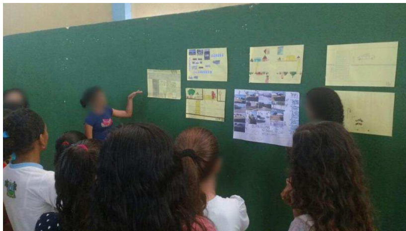
Figura 14: Apresentação dos cartazes e das fotos desenvolvidos nas aulas anteriores

Como já citado, durante a simulação também ocorreu à apresentação dos cartazes e das fotos confeccionados nas etapas anteriores.