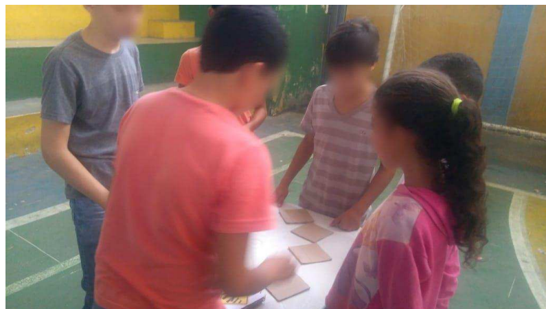
Figura 12: Jogo da memória/etapa da transformação de atitudes

Jogo da memória – foi pensado com o objetivo de que, através da sua aplicação, os estudantes aprendessem as placas de trânsito. Este jogo foi feito com placas de trânsito impressas da internet e presas em pequenas partes de caixa de papelão, e se deu de forma que os estudantes colocavam as placas soltas e embaralhadas em cima de uma mesa e dois ou três participantes disputavam. Quem formasse mais pares de placas ganhava o jogo.