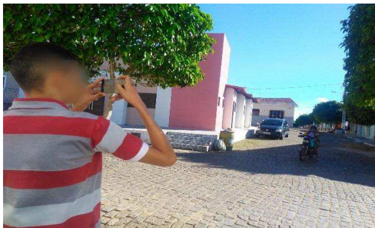
Figura 6: Desenvolvimento da aula 3 – aula de campo para a observação do trânsito local.

Essa atividade teve o intuito de estimular a observação e possibilitar que estudantes registrassem o trânsito na cidade através de fotografias. Eles foram divididos por grupos para fazer o registro na cidade (Figura 6). Posteriormente, as fotos foram apresentadas através de um mural com explicações dos estudantes sobre o que parecia inadequado.