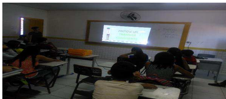
Figura 5: Atividade com Vídeos (aula 2)

Ainda nessa etapa de problematização, alguns vídeos relacionados ao trânsito e a como se educar para o trânsito foram mostrados. Isto com o intuito de explorar a temática. Os vídeos são sempre uma estratégia muito boa para auxiliar na aprendizagem dos estudantes, tendo em vista que os estudantes sempre demonstram interesse por esse recurso. Os vídeos escolhidos mostravam as regras, normas e leis de trânsito, como também ensina fazer um trânsito mais seguro e consciente, além de uma paródia sobre o semáforo e regras no trânsito.