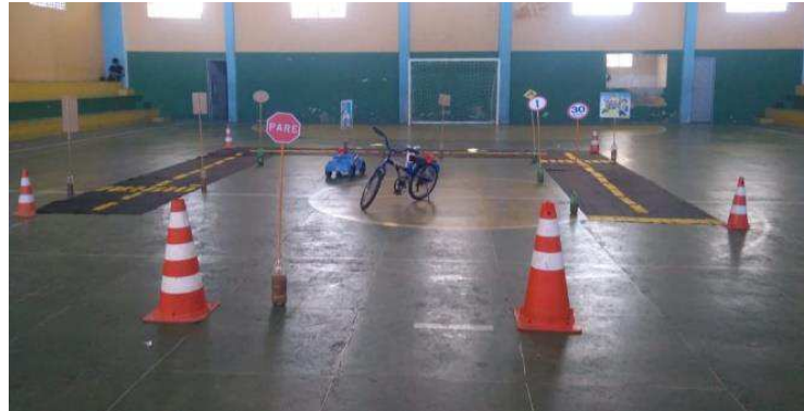
Figura 10: Etapa da transformação – Atividade “Simulação de Trânsito”