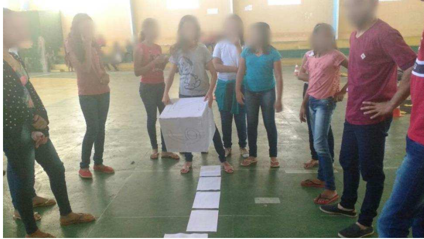
Figura 11: Jogo de tabuleiro/etapa da transformação de atitudes