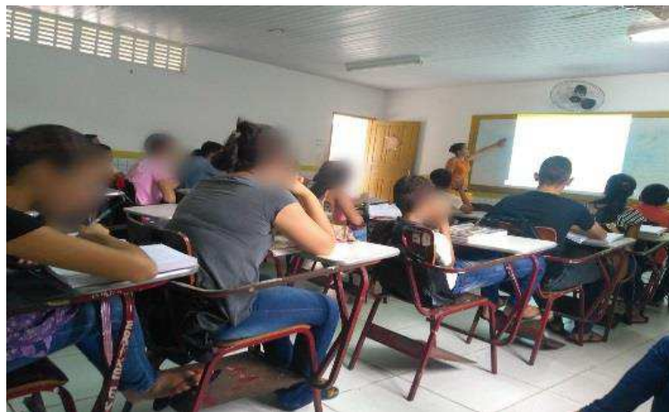
Figura 7: Aula expositiva/dialogada sobre leis e placas de trânsito

Iniciamos uma aula expositivo-dialogada com o auxílio de projeção multimídia. O assunto foram as leis e placas de trânsito para que, através da teoria e de conceitos, os alunos incorporassem novos conhecimentos sobre o tema. Seleccionamos algumas leis do Código de Trânsito Brasileiro (CTB) e algumas placas de regulamentação, advertência e indicação, explicando suas funções no trânsito.