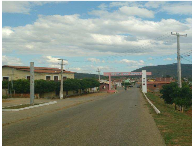
Figura 3: Foto da entrada da cidade São Bento do Trairi/RN