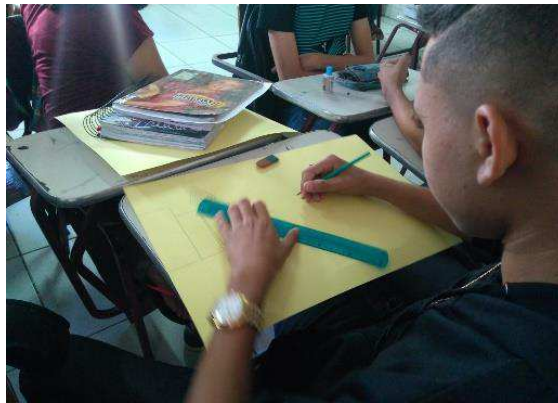
Figura 9: Etapa da transformação – Atividade de desenhos em cartazes

Essa é a etapa da transformação de atitudes, aonde os estudantes colocaram em prática todos os conhecimentos produzidos. As atividades de desenhos, de recorte e de colagem foram construídas em sala de aula para que houvesse a apresentação dos cartazes na simulação de trânsito, em que houve a consolidação de todo o trabalho e todas as outras etapas citadas anteriormente foram colocadas em prática.