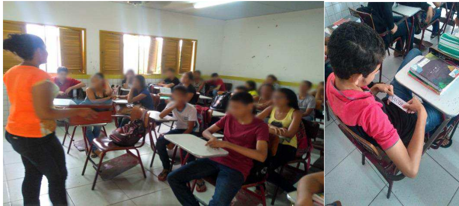
Figura 4: Atividade de percepção inicial do tema