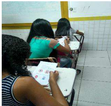
Figura 8: Etapa do desenvolvimento – Atividade “Exercício de Fixação”

Nesta aula foi realizada uma atividade complementar na qual os estudantes, através de um exercício de fixação sobre leis e placas de trânsito, praticaram ainda mais os conhecimentos construídos na aula anterior. O exercício continha questões como: complete a frase e algumas imagens de placas de trânsito para que eles colocassem o significado de cada placa (APÊNDICE I).