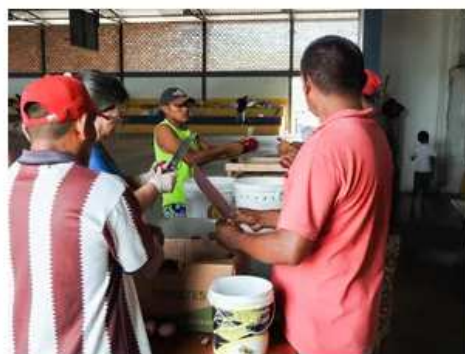
Para manter a ordem no local, abrigados ajudam na cozinha, limpeza e manutenção do local

O chefe da Divisão de Operações Emergenciais da Defesa Civil explicou que os líderes são responsáveis por passar as regras aos demais abrigados.