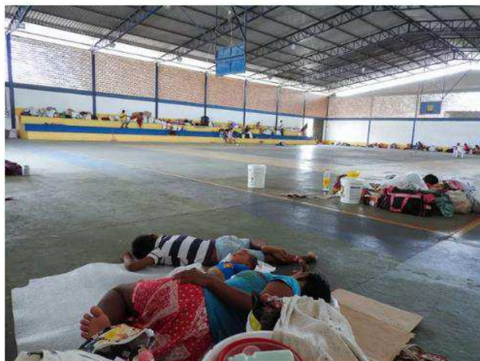
Famílias de venezuelanos abrigados dorme no chão em abrigo improvisado em ginásio poliesportivo