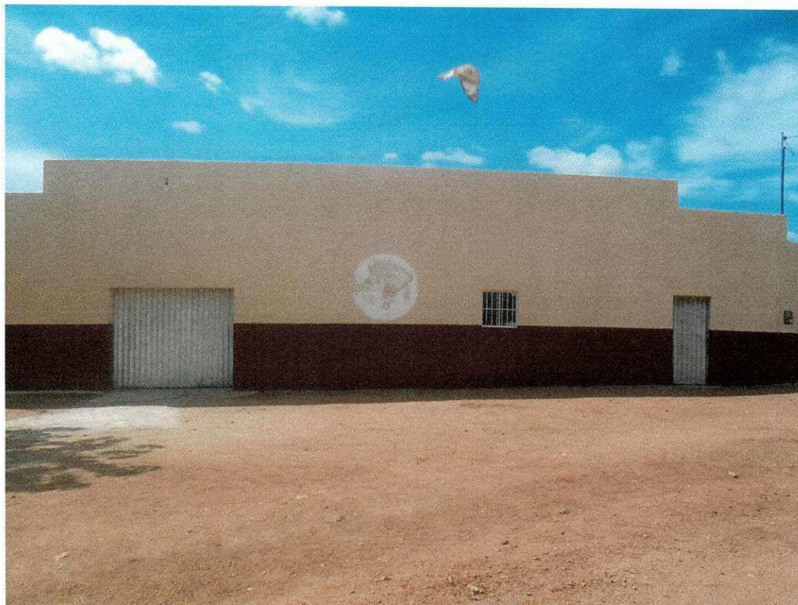
Figura 1 - Fachada da frente da associação