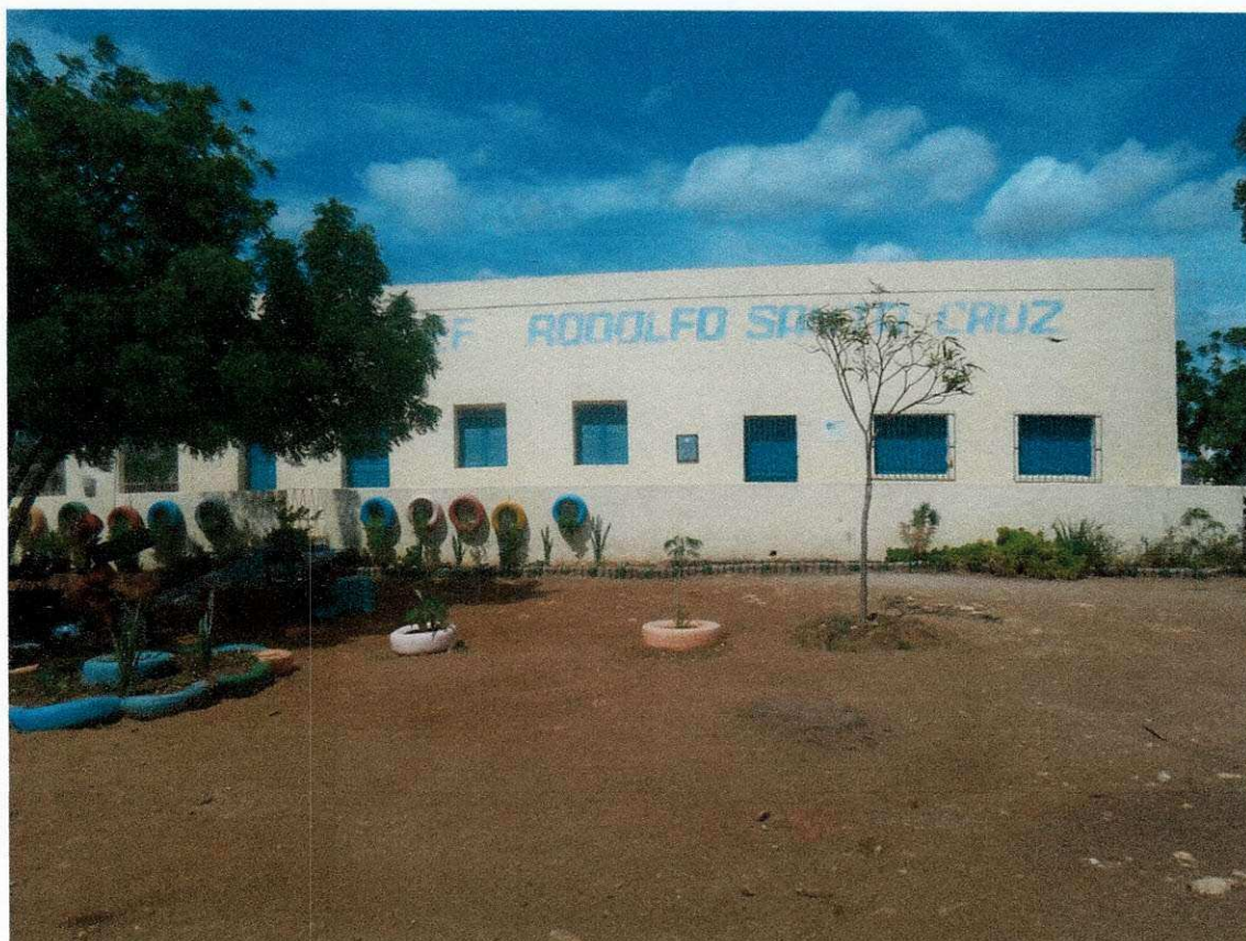
Figura 3 - Fachada da Escola Rodolfo Santa Cruz.

estudantes eles frisam muito que gostariam de dar continuidade aos estudos mas infelizmente parou-se as aulas, pois segundo a Secretaria de Educação Municipal, o número de alunos era insuficiente.