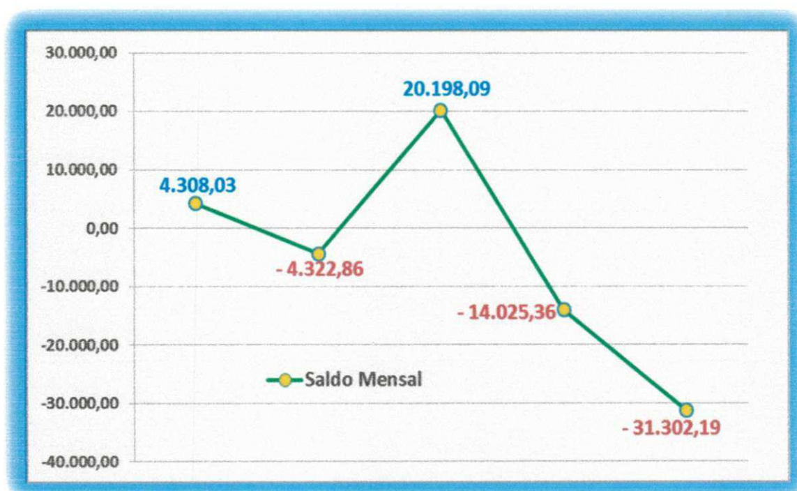
Gráfico 02 – Saldo absoluto médio mensal do RPPS do município de Serra Branca (2009/2013)

Fonte: Autor. Baseado nos dados do Tribunal de Contas do Estado da Paraíba, 2013.