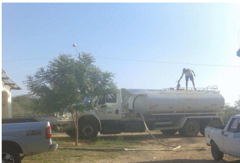
FIGURA 3: Abastecimento de água do abatedouro proveniente de carros pipas

O volume de água utilizado é proveniente de carros pipas Figura 3 do município, sendo necessário abastecimento todos os dias de abate.