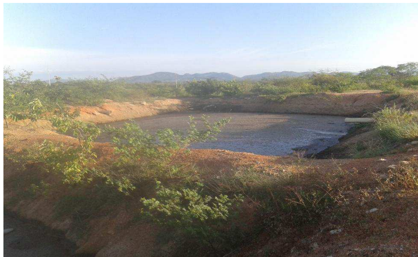
Figura 4: Lagoas de estabilização