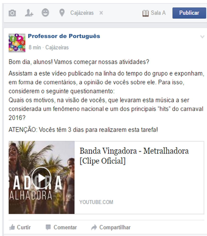
Fig.1: Recorte de uma imagem obtida de um grupo do Facebook criado apenas para exemplificar o procedimento metodológico da proposta pedagógica.

Nesta etapa o professor deve iniciar explanando sobre o gênero Facebook , sua composição. Depois, com o grupo no Facebook já criado, o professor acessa-o e publica, na linha do tempo, o vídeo da música “Metralhadora” da Banda Vingadoras e instiga a opinião de seus alunos com o seguinte questionamento: Exponha a opinião de vocês sobre a letra desta música e justifiquem porque vocês acham que essa música foi considerada como um fenômeno nacional e como um dos principais hits do Carnaval 2016? O professor aguarda para que todos os alunos possam dar sua opinião, inclusive observando os contra-argumentos que podem surgir. Nesta etapa o professor deve estipular quantos dias serão necessários para que se cumpra a atividade (um dia, por exemplo). Vejamos o exemplo 7 de como o professor proceder: