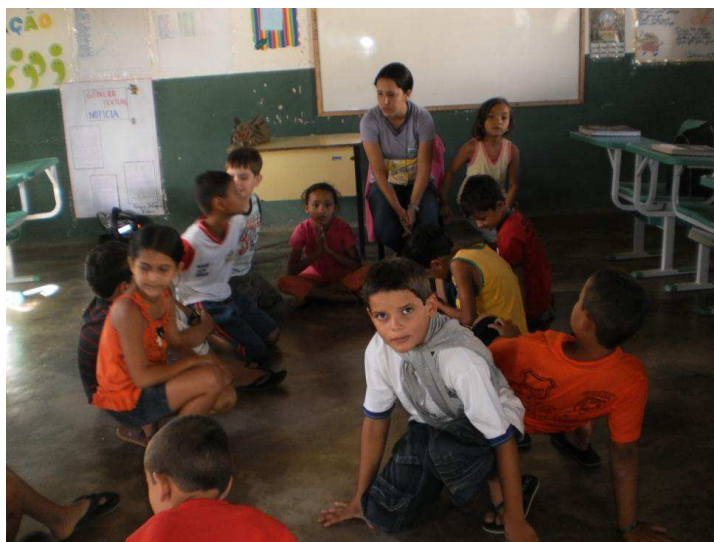
Figura 4 – Roda de conversa 1

Nas Figuras 4 e 5, os educandos participavam de uma roda de conversa, após a leitura deleite.