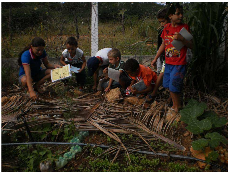
Figura 6 – Observação da horta

nominal: singular e plural. Pedo, ainda, que desenhem o local visitado (onde estão as rúculas), conhecido como “buraco de fechadura”, e as plantas que eles viram nesse espaço, conforme se observa nas Figuras 6, 7 e 8.