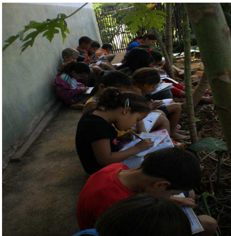
Figura 7 – Registro pelos alunos das observações na horta