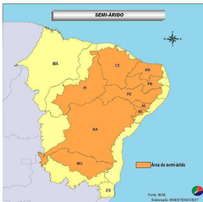
Figura 3 – Semiárido Brasileiro

Por possuir uma grande extensão geográfica, o Semiárido Brasileiro 4 corresponde à área de abrangência de secas, incluindo, no Nordeste, os estados do Piauí, Ceará, Rio Grande do Norte, Paraíba, Pernambuco, Alagoas, Sergipe e Bahia, e no Sudeste, o norte de Minas Gerais, por apresentar características físicas, econômicas e sociais semelhantes aos demais (REIS, 2004, p. 1), de acordo com a Figura 3: