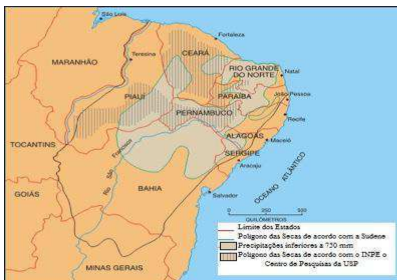
Figura 2 – Polígono das Secas

O Semiárido Brasileiro recebeu, ao longo da história, outros nomes, como Sertão e o Nordeste das Secas. Em 1936, ocorreu a primeira delimitação oficial dessa região com o Polígono das Secas, como mostra a Figura 2: