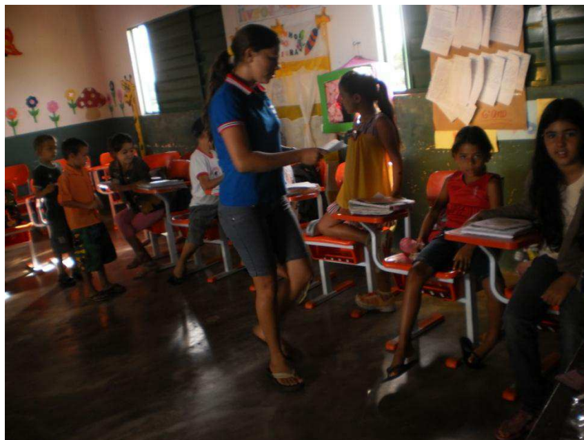
Figura 8 – O retorno à sala de aula: registro individual em desenho da horta.

Após o intervalo, o assunto abordado foi as drogas – os conhecimentos prévios foram bem explorados, com interação entre professora e educandos. Perguntados se conheciam as drogas, os educandos responderam que sim e citaram o fumo, a maconha, o álcool (cachaça). Todos falaram sobre pessoas da família que fazem uso dessas substâncias. Um dos educandos mencionou que seu pai chegava bêbado em casa e fez gestos, explicitando como ele agia ao chegar em casa. Logo, outros meninos e meninas começaram a relatar sobre suas avós que fumavam, seus pais que lhes davam bebida, e outros parentes que morreram porque bebiam demais.