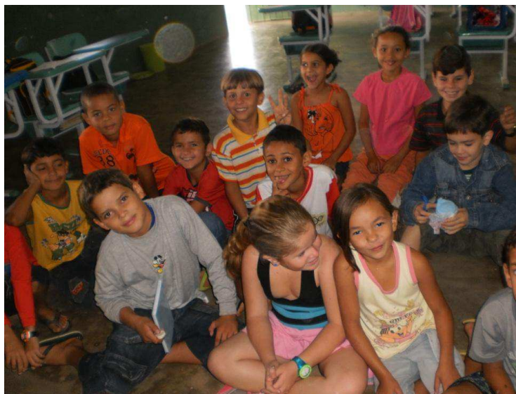
Figura 5 – Roda de conversa 2

Em seguida, foi feita a correção do Para casa – uma pesquisa sobre o mosquito da dengue. Cerca de 10 educandos pesquisaram e trouxeram o nome do mosquito, 03 alegaram não terem feito porque os pais não sabiam e 02 esqueceram de fazer. A Professora explicou que o tal mosquito chama-se Aedes Aegypti , e escreveu o nome na lousa para que os educandos passassem para o caderno. Revisaram juntos os sintomas da dengue e como deve ser a sua prevenção. Essa turma mostrou-se muito dinâmica e participativa.