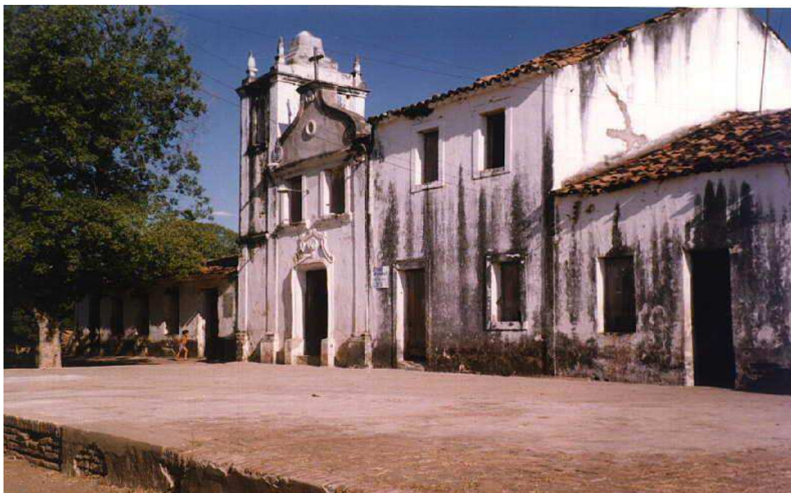
A fazenda antes da restauração de 1998