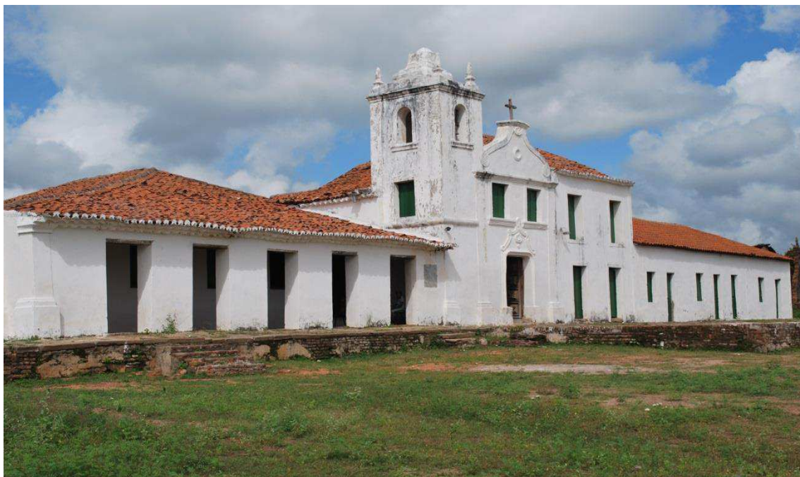
O Patrimônio depois do fim da restauração em 2002