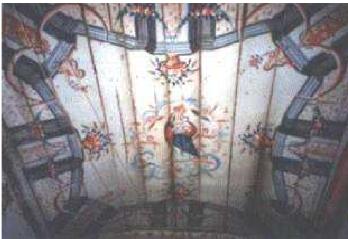
Teto da Capela de Nossa Senhora Imaculada da Conceição