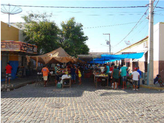
Imagem 3.1: Circulação de pessoas na Feira livre de Pombal (Arquivo da autora).

O ritmo da cidade durante a fase do dia nos traz a percepção de movimento e fluxo das pessoas diante da paisagem/imagem em que se enquadram no dia a dia. Por assim dizer, percebemos a necessidade de analisar as imagens levando em conta as principais maneiras de sociabilidade das pessoas neste espaço de tempo. Esta sociabilidade está posta no movimento de circular e se encontrar das pessoas pela cidade, exatamente, nestes pontos de referências tais como a feira livre, a Praça do Centenário, as calçadas das lojas em que as pessoas circulam, se encontram e trocam informações sobre si e sobre outros.