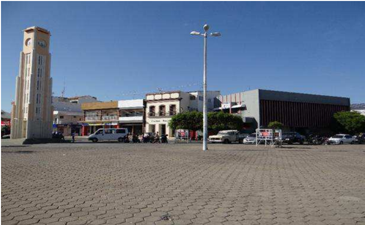
Imagem 4: Encontro das Praças do Centenário e Getúlio Vargas (detalhe para a Coluna da Hora em amarelo.

A imagem acima mostra o local onde as Praças Getúlio Vargas e do Centenário se encontram, dois patrimônios que fazem parte da composição do centro histórico da cidade de Pombal. Na imagem, observamos a coluna da hora construída em 1940 durante o governo do Prefeito Francisco de Sá Cavalcante. Foi e ainda é usada como ponto de referência para o encontro de pessoas nas festividades no centro da cidade. Demarca um tempo e uma memória do mundo do trabalho em Pombal, remete a Fábrica Brasil oitocista que remodelou o cotidiano social da cidade e etc.