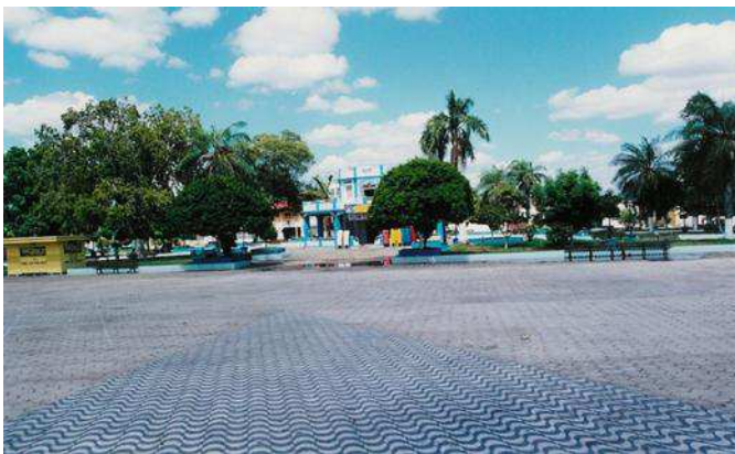
Imagem 2: Praça do Centenário.

Observemos mais uma imagem, cujo recorte e espaço é descrito na seqüência,