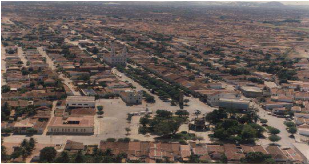
Imagem 3: Centro histórico de Pombal visto de cima.

Abaixo temos uma imagem central da cidade de Pombal vista de cima em especial da Praça do Centenário, do coreto e todo o centro histórico da cidade que representa um espaço de encontro para as pessoas em geral.