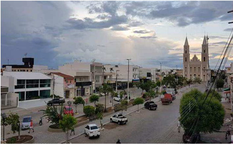
Imagem 1: Vista da Praça Getúlio Vargas – Pombal-PB.

Como indicamos na legenda, a imagem acima é um recorte do centro histórico de Pombal, cuja praça que se nota é denominada de Getúlio Vargas. Sobre essa perspectiva VIEIRA (2016, p. 27) fala,