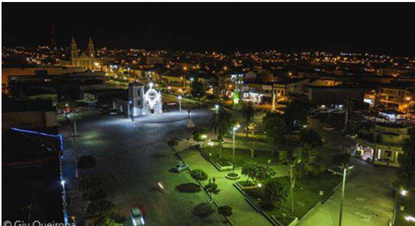
Imagem 7: Centro histórico a noite.

Iluminada desde cedo, por volta das 17:40 da tarde, a cidade se traduz em um misto de Paris com Londres e Rio de Janeiro numa versão sertaneja diminuta, mas que salta aos olhos de quem a enxerga tanto ao vivo como nas imagens reproduzidas por fotógrafos entusiasmados com o brilho da Terra de Maringá. Há na cidade uma calma, uma órbita de silêncios que só são rompidos pelo buzinar de algum veículo ou o choro agudo de uma criança em meio a Praça do Centenário. Ela se traduz em palco da noite!