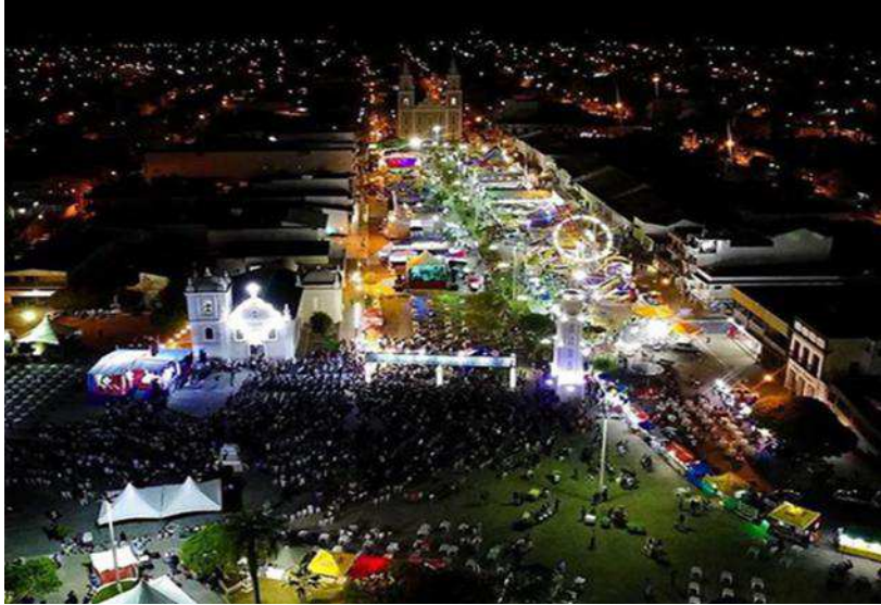
Imagem 9: Vista do Centro Histórico.

Atentando para o que já foi dito, vale explicar que a Festa do Rosário é uma festa religiosa/profana mais importante da cidade (a festa da padroeira, Nossa Senhora do Bom Sucesso, fica em segundo plano). Nessa época do ano, mês de outubro a festa acontece, antecedida por nove noites de novena que acontecem a frente da Igreja de Nossa Senhora do Rosário co-padroeira da cidade. Na ocasião, os filhos de Pombal que já não moram na cidade retornam à cidade para vivenciar esse momento. Os filhos de Pombal aqui retornam para rever amigos e lembrar sua infância feliz. As ruas do centro histórico ficam iluminadas pelas luzes dos parques de diversões instalados na cidade para a ocasião da festa que atraem a atenção da criançada e o dinheiro do bolso dos seus pais. A festa tem grande valor social, histórico, cultural por fazer parte da cidade desde tempos vindouros e por ter significado especial para cada Pombalense. Cada grupo participante constrói e significa esses momentos através de narrativas que se multiplicam sobre a cidade. A cidade não é uma múltipla quanto as narrativas que a constrói e desconstrói cotidianamente.