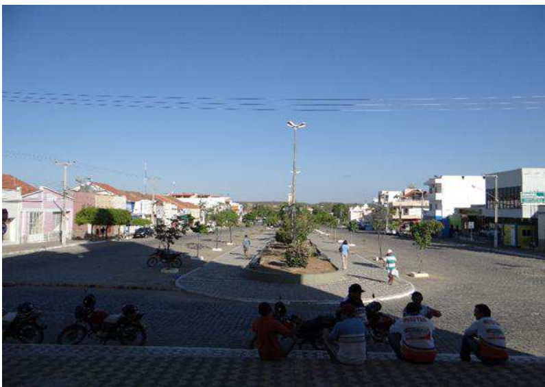
Imagem 5: Calçada da Igreja matriz e Praça Getúlio Vargas.

Apesar da autora se referir em linhas gerais a técnica da fotografia, ela fala daquilo que ela produz e que as pessoas também em sua memória, o fazem: recortam, selecionam e enquadram os lugares e paisagens conforme suas intencionalidades. Percebe-se, portanto, a cidade com seu olhar particular, imprimindo nela sua interpretação. O que faz com que nos deparemos com momentos de fluxo de olhares numa imagem que inspira encontros numa passagem de pessoas. Vejamos a imagem a seguir: