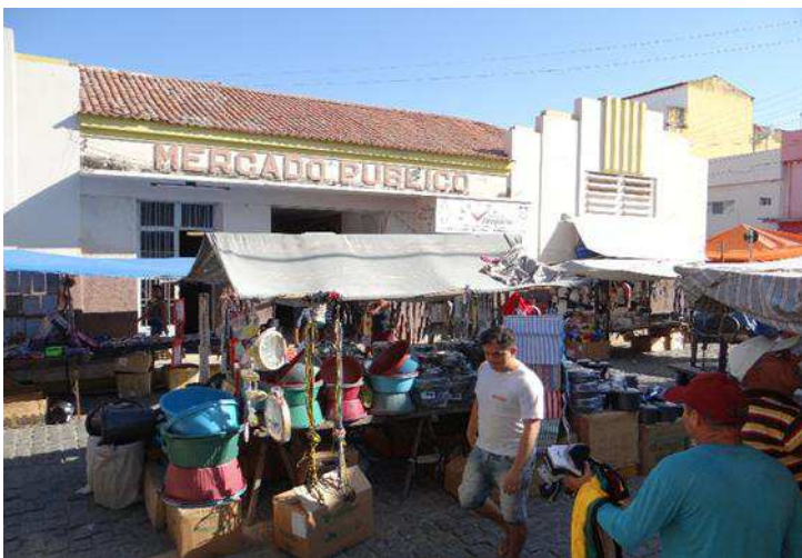
Imagem 6: Feira livre de Pombal.

Vê-se desse modo que há um ponto de equilíbrio ou intersecção entre a imagem que se quer captar e a paisagem que, para nós habitantes desta cidade, é comum termos contato todos os dias. Abaixo temos o Mercado Público como uma paisagem da feira, ponto de encontros e fluxo urbano exemplos de paisagem e imagem.