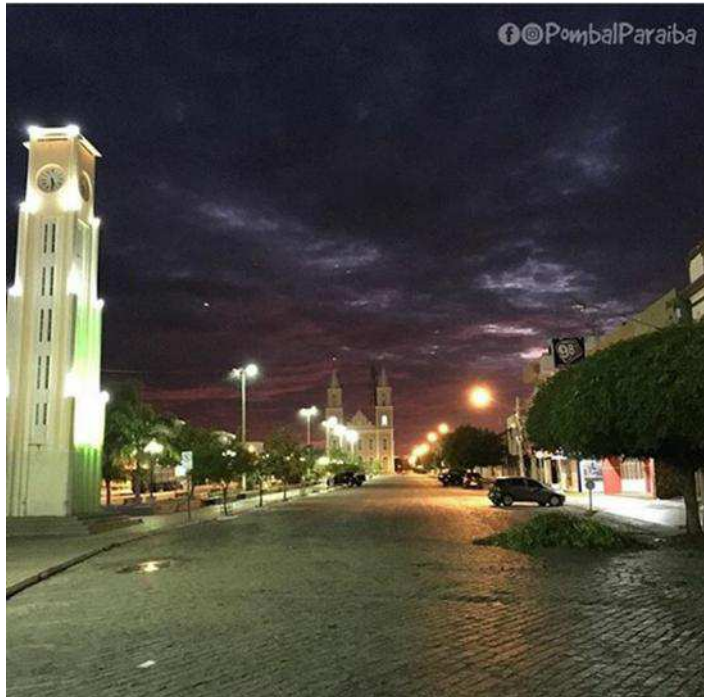
Imagem 8: Rua Cel. João Carneiro – Centro.

A fotografia que aparece acima mostra parte do centro histórico de Pombal de madrugada, quando as ruas já se encontram vazias, aos poucos a aurora de um novo dia aparece e as luzes que iluminavam a noite dão lugar a um novo amanhecer que surge no horizonte. Mais um dia se projeta, mais uma vez os pombalenses aos poucos se acordam para mais um dia de trabalho transitando as ruas de Pombal. A cidade é o lugar de suas vivências, sua moradia, seu trabalho, seus sonhos e desilusões, é esse misto de sentimento e pertença que forma a cidade.