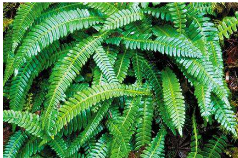
Figura 7. Samambaia

Santos e Sylvestre (2006) avaliaram ainda a toxicidade da planta em camundongos e notaram que os báculos amargos podem induzir a formação de tumores no trato gastrointestinal, assim como ação carcinogênica e mutagênica. Kim (1974) no trabalho com Dryopteris filix-mas (L.) Schott (Dryopteridaceae) evidenciou que a resina extraída do óleo desta espécie vegetal pode ser ativa contra Hymenolepis diminuta , quando administrada oralmente numa dose de 3 mg/kg em camundongos parasitados.