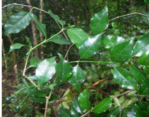
Figura 5. Spiranthera