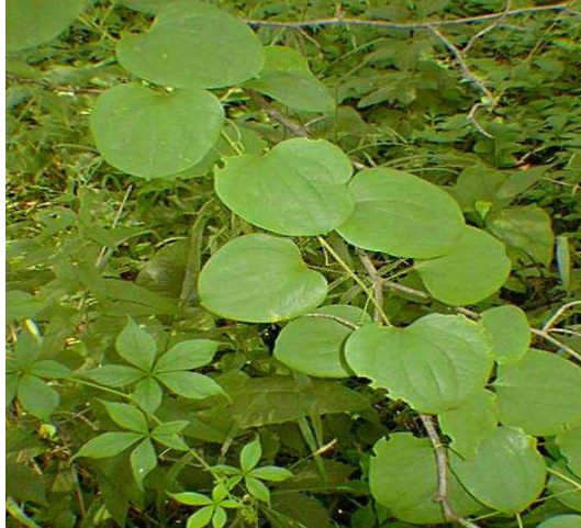
Figura 3. Smilax sp.