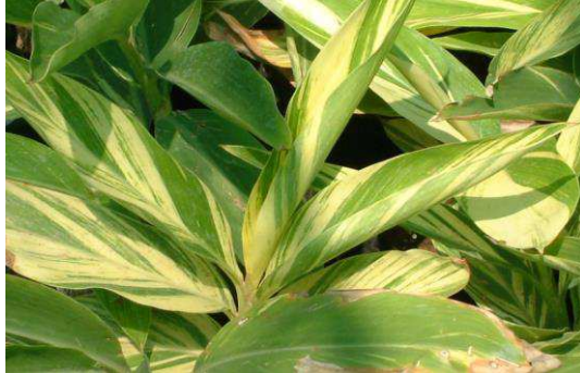
Figura 6. Alpinia speciosa

(DMNL), de 0,3 mL/Kg. Por via oral a DL50 foi de 4,2 mL/Kg e a DMNL, de 1,7 mL/Kg, chegando a conclusão de que a planta não apresentou efeitos tóxicos significativos.