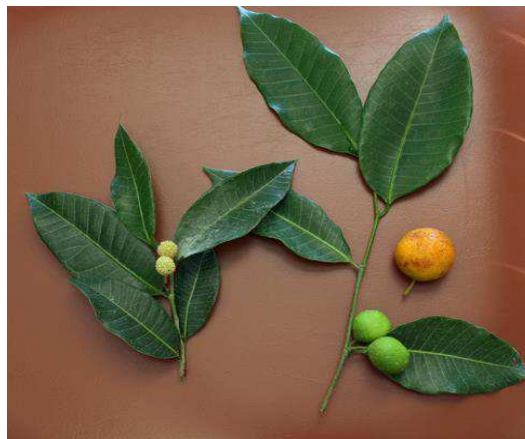
Figura 8. Brosimum sp.

Cunha et al. (2008) realizou estudos de toxicidade pré-clínica para o conhecimento da dose letal aproximada (DLA) e da dose letal mediana (DL 50 ). O estudo foi realizado com o exudato da raiz do Brosimum gaudichaudii Trécul em animais de laboratório. O exudato foi administrado por via oral e intraperitonal, e as mortes foram observadas por um período de 14 dias. Os resultados mostraram que a DLA por via oral foi de 3750mg/kg, DLA por via intraperitonal foi de 2920mg/kg, DL 50 por via oral foi de 3517,54mg/kg e DL 50 por via intraperitonal foi de 2871,76mg/kg, chegando a conclusão de que a planta é considerada de baixa toxicidade.