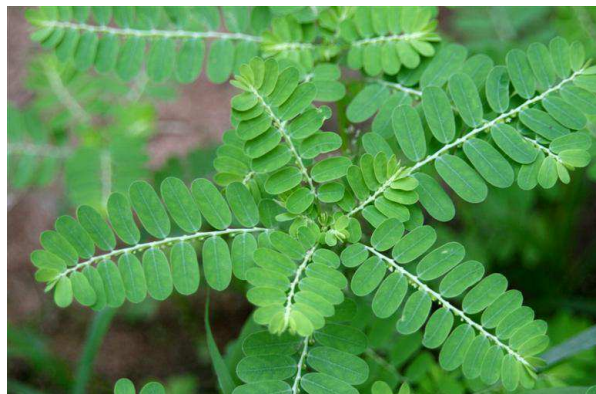
Figura 2. Phyllanthus sp.

Um estudo clínico realizado para avaliar ocorrência de possíveis efeitos toxicológicos agudos, quando se empregaram doses popularmente utilizadas por pacientes litíasicos (chá preparado com o pó da planta, em 200 mL de água, tomado pela manhã) demonstrou que a administração de doses sucessivas e crescentes (5, 10 e 15g) de P. niruri a seis voluntários sadios, com intervalo de uma semana entre elas, não provocou alterações no exame físico, nos testes psicológicos nem alterações eletrocardiográficas e de toxicidade sanguínea (SANTOS, 1990).