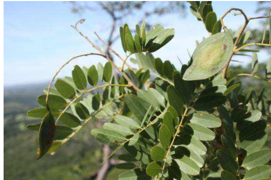
Figura 4. Pterodon emarginatus Vogel

induziu efeitos tóxicos. Em outro estudo comprovou-se a ação genotóxica de P. emarginatus em linfócitos T humanos (MACHADO et al. 2011).