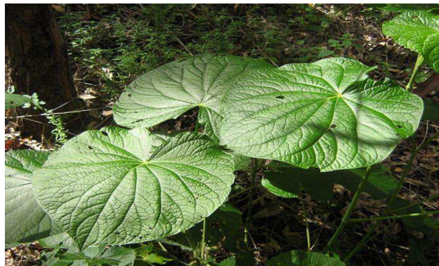
Figura 1. Pothomorphe umbellata

Barros et al.(2005), realizou estudos de toxicidade aguda e subcronica com o extrato etanólico bruto da raiz de Pothomorphe umbellata L. onde foram administrados para o teste de toxicidade aguda uma dose de 1,2g e 5g/kg do extrato em camundongos e ratos e ficaram em observação por um período de 14 dias. Já no estudo de toxicidade subcronica foram administradas doses de 500mg, 5 dias por semana durante 40 dias nos dois grupos de animais. Em ambos os estudos, a toxicidade não foi comprovada, evidenciando uma segurança na utilização dessa planta.