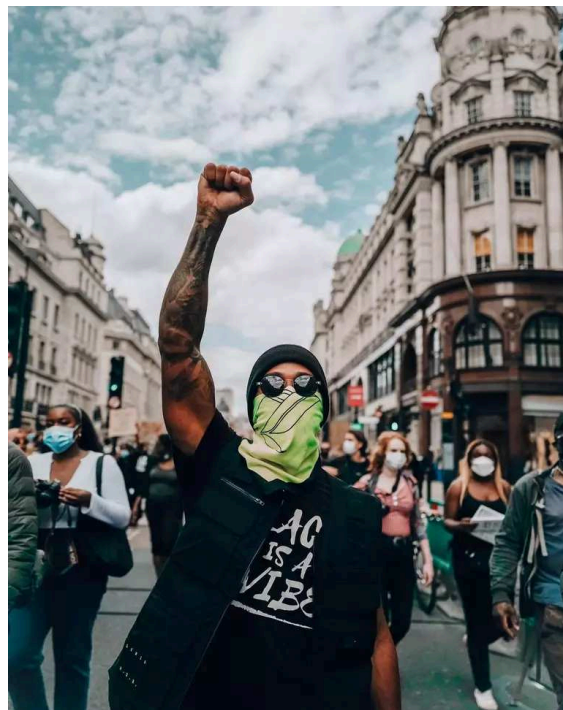
Figura 5: Lewis Hamilton participando de protesto contra a violência policial em Londres (2020)

Já na Figura 5, Hamilton está participando ativamente de um protesto nas ruas de Londres, dia 21 de junho de 2020, ainda no contexto da pandemia, em prol do movimento “ Black Lives Matter ”. Diz Hamilton em entrevista 8 : “ Queria chegar ao fim dessas corridas primeiro para que pudesse dar lugar a essa plataforma, colocá-la o máximo possível sob os holofotes ”.