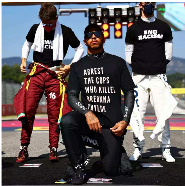
Figura 2: Lewis com camisa pedindo a prisão dos policiais que mataram Breonna Taylor e que desencadeou reações dentro da F1.

Na imagem da Figura 2, visualiza-se o piloto no dia do primeiro GP da Toscana, em 20 de setembro de 2020, protestando, antes da corrida e do pódio.