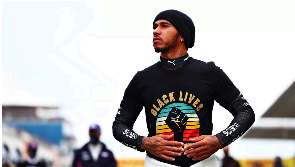
Figura 1: Lewis Hamilton no GP da Turquia (2020).