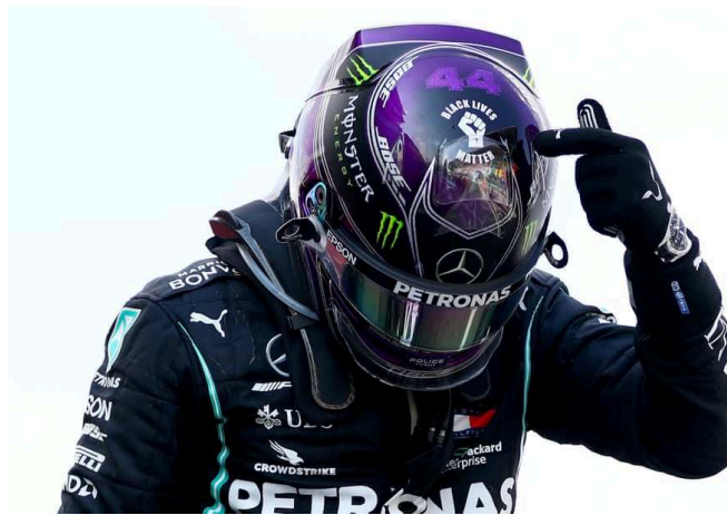
Figura 3: Lewis Hamilton no GP da Espanha em 2020, com o capacete em apoio ao movimento "Vidas Negras Importam" .