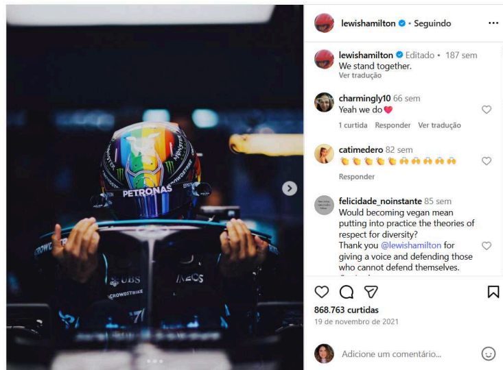
Figura 4: Hamilton com o capacete da bandeira LGBTQIAPN+ no GP do Catar (2021).