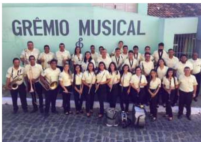
Imagem12. Fotografia da banda atual.