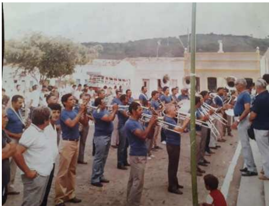
Imagem 4. 15 de janeiro de 1985 dia do padroeiro da cidade Santo Amaro, mas conhecido como o santo fujão.