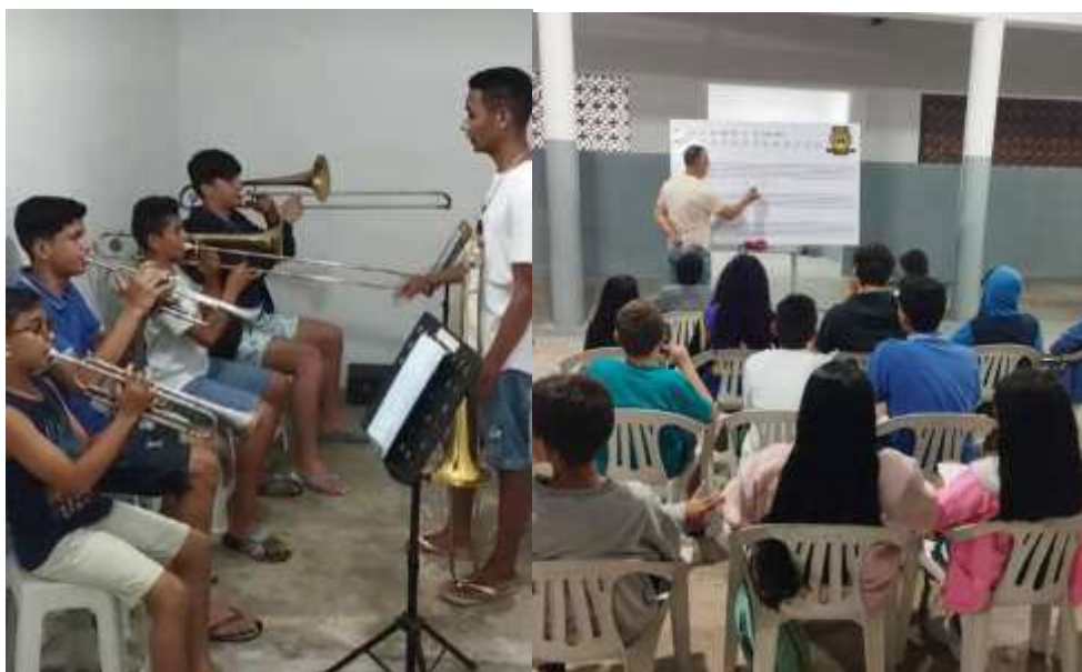
Imagem 15. Grêmio Musical Dom Luiz de Britto Formação de Sociocultural de jovens, 13 de nov. de 2024