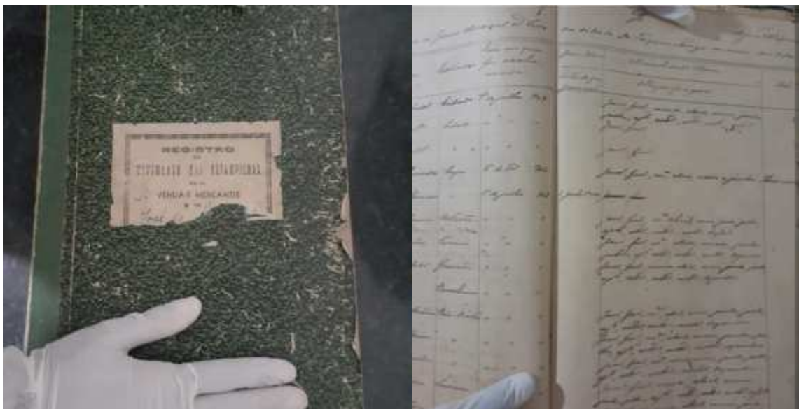
Imagem 2. Livro de Registro de Sócios, 1902.