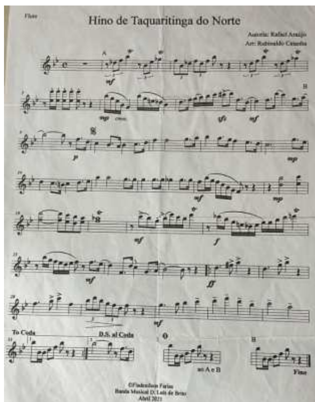
Imagem 14. Partitura da Banda Musical Dom Luiz