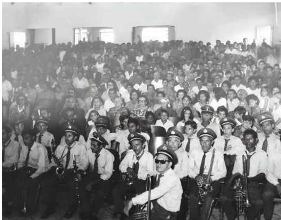
Imagem 3. Inauguração do cinema aproximadamente entre os anos 1968 e 1972