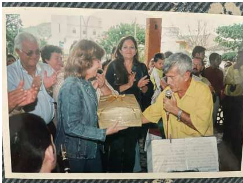
Imagem 10. Entrega de novos instrumentos no dia 15 de novembro de 2006.