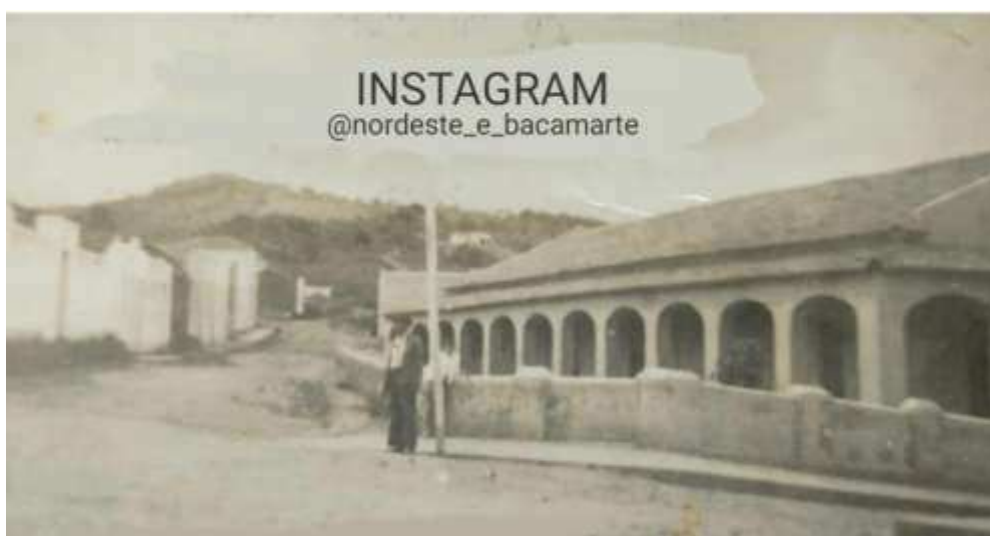
Imagem 5. Sede do Grêmio Musical Dom Luiz de Brito, 1946.